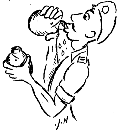
הוא כילה שתי מימיו

מלים טובות על מבצע שהצליח או על כיתה שהצטיינה ידענו שאכן ראויים אנו לכך. הצלחתו היתה הצלחתנו וכשלונו כשלונו. עד מהרה התלכדנו כמשפחה מגובשת.