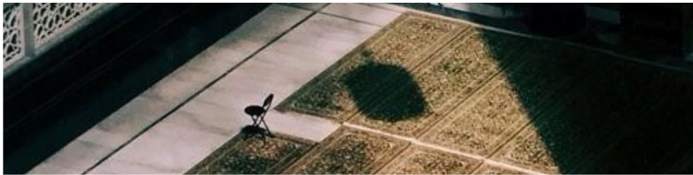
"פנס רמצי'אן", אחד מסמלי החודש.

מדי שנה בהתקרב חודש הצום המוסלמי רמצי'אן, מתרבות ההתרעות לפיגועים. השנה על-פי המשוער יחל רמצי'אן ב־23 במרס, ומורגשת תכונה מיוחדת לקראתו בשל גל הפיגועים והמתיחות בירושלים ובגדה. הקשר בין חודש רמצי'אן לג'האד – המאמץ הדתי ולא דווקא הצבאי – הוא עמוק, וארגוני הג'האד מנצלים אותו כדי לעודד את פעיליהם ואת תומכיהם להגביר את הג'האד המלחמתי־צבאי בחודש הצום. מטרת מאמר זה היא לעמוד על קשר זה, כמו גם להניח בסיס מדויק של ידע ביחס לחודש רמצי'אן.