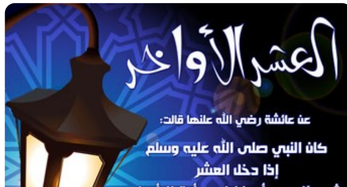
חדית' מפי עאא'שה על השתדלות הנביא בעשרת הימים האחרונים

עשרת הימים האחרונים של רמצי'אן (על-פי המשוער השנה 12 באפריל) הם החשובים ביותר בחודש. שיאם הוא הלילה שבו החל לרדת הקראא'ן ומכונה "ליל הגזירה" (לילת אל-קדר). בדרך כלל הוא חל בלילה שבין 27/26 בחודש רמצי'אן (על פי המשוער השנה 17 באפריל. השיעים מציינים את לילת הגזירה ב־19, 21 ו־23). במסורות שונות מתועד כי הנביא מחמד השקיע מאמץ רב מבחינה דתית בעשרת הימים האחרונים של חודש הצום יותר מבכל מועד אחר, 18 ולפי הקראא'ן [97:2] "ליל הגזירה טוב מאלף חודשים". כלומר מעשה טוב בלילה זה מזכה בשכר עצום של אלף חודשים שבהם נעשו מעשים טובים. בלילה זה, לשון הקראא'ן, יורדים המלאכים מן השמיים ומודיעים למוסלמים על גורלותיהם בשנה הקרובה. כיוון שארגוני הג'האד רואים בלחימה נגד ישראל מצווה שהיא חובה אישית, סביר שהמוטיווציה לביצוע פיגועים (לשיטתם, פעולות ג'האד) תגבר בימים אלה.