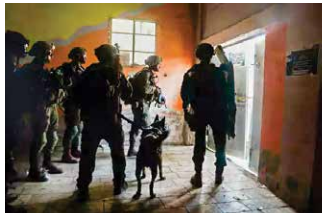
פשיטת כוח צה"ל בגנין במהלך "בית וגן". פשיטות אלה אינן יוצרות הרתעה כאשר מדובר בטרור דתי. אדרבה, ככל שהפעילות נגד ארגוני הטרור תהיה אגרסיבית יותר, הם יראו בה קידום יום הדין ויתעודדו מכך.

מהם כבר נכחדו (למשל ארגון "הנמרים הטמיליים" שהוכרע ב-2009) 3 . עיון ברשימה יגלה כי עשרות ארגוני הטרור בעלי האידיאולוגיה הדתית המוצגים בה הם אסלאמיים. בשנים האחרונות אנחנו רואים מגמת "הדתה" של המאבק הלאומי בגזרתנו. לדוגמה הצטרפות פת"ח לפיגועי ההתאבדות, התבטאויות של בכירי הפת"ח לעידוד תופעת