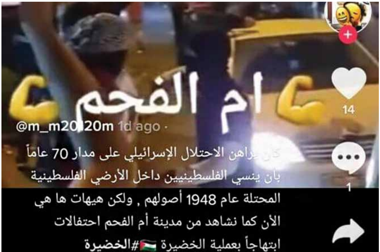
חגיגות באום אל-פאחם - לאחר הפיגוע בחדרה ב-2022. גילויי השמחה הרבים המתפרסמים ברשתות החברתיות לאחר פיגועים בישראל והחגיגות הספונסוניות ברחובות הערים לאחר רצח יהודים מעודדים את המפגעים הבאים.