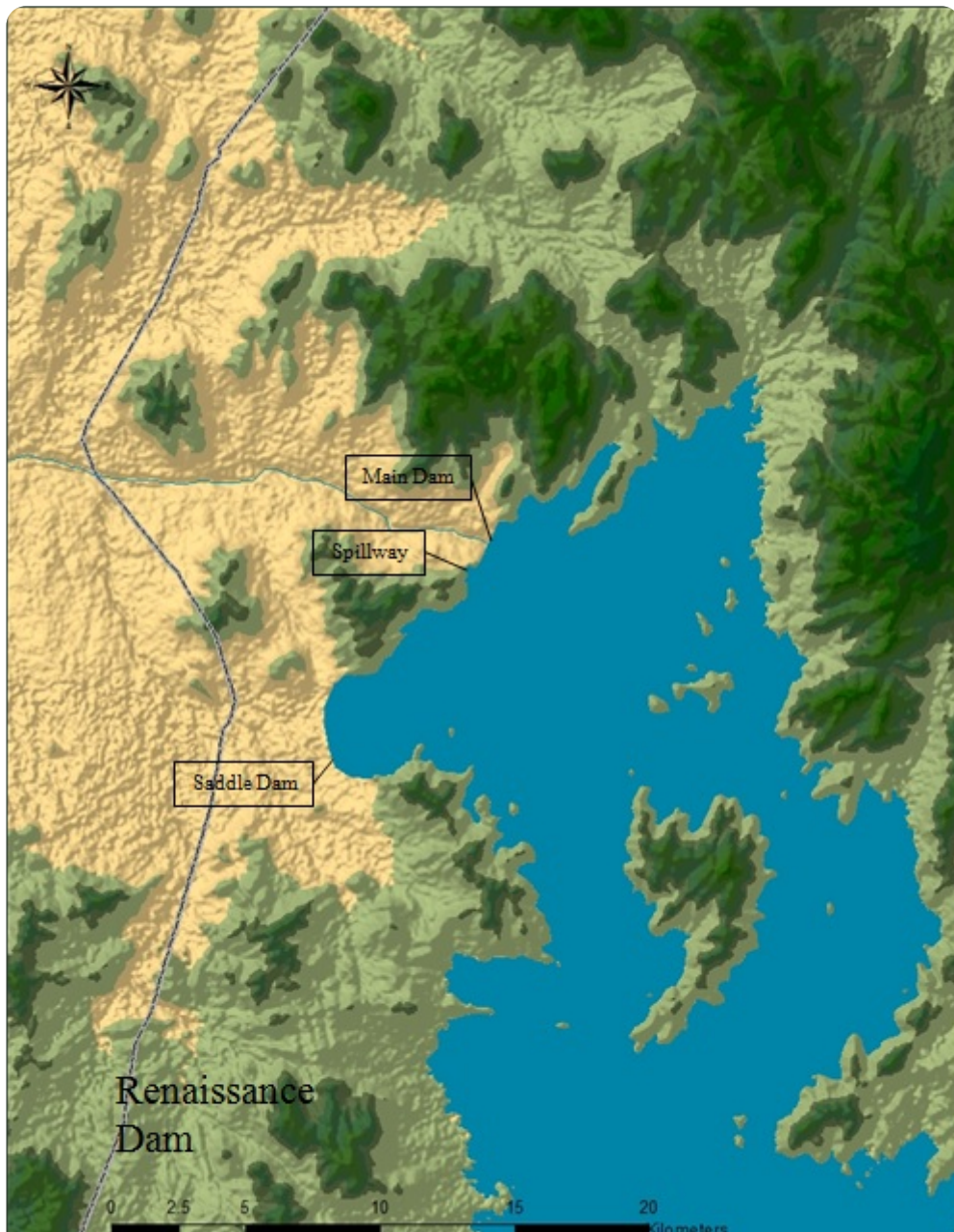
סכר התחייה באתיופיה

הניסיון ליצור מסגרת לשיתוף פעולה אזורי באגן הים האדום מונע אף הוא על-ידי דינמיקות תחרותיות. 30 בינואר 2020 נוסד "המועצה של מדינות ערב ואפריקה שגובלת בים האדום ובמפרץ עדן", לאחר מאמצים דיפלומטיים אינטנסיביים שהשקיעה ערב הסעודית. מאז לא עלה בידי הארגון לשמש גוף יעיל לשיתופי פעולה. למרות שהרעיון המקורי היה לקדם שיתוף פעולה בענייני כלכלה, תרבות וסביבה, בערב הסעודית חתרו להתמקד מחדש דווקא בנושאים הפוליטיים והביטחוניים שעל סדר היום. הגדרה צרה של "מדינות חוף" המעיטה בערכם של בעלי עניין חשובים, וכנראה החריגה אותם בכוונה. אלה כוללים את אתיופיה, אבל גם את פונטלנד וסומלילנד. עצם הכנסתה לארגון של סומליה (משטר שאינו שולט ברוב שטח המדינה, ונתמך על-ידי טורקיה וקטר), מעיבה על היכולת להגיע למטרות משותפות עם המחנה הפרו־סעודי.