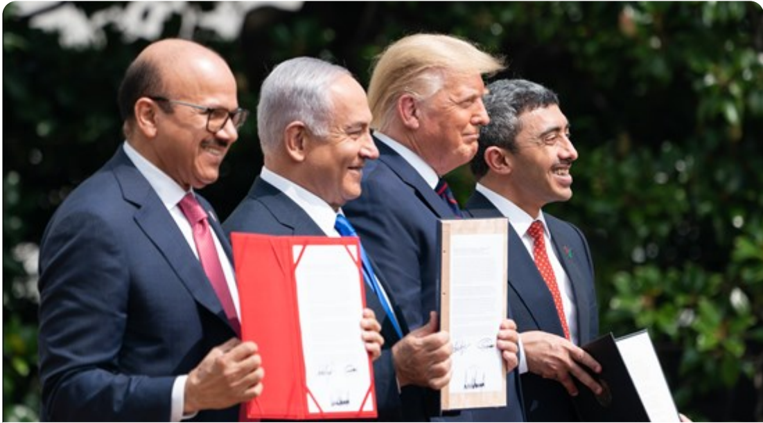
עבד אל־טיף א־זיאני, בנימין נתניהו ודונלד טראמפ בטקס החתימה על ההסכם, 15 בספטמבר 2020