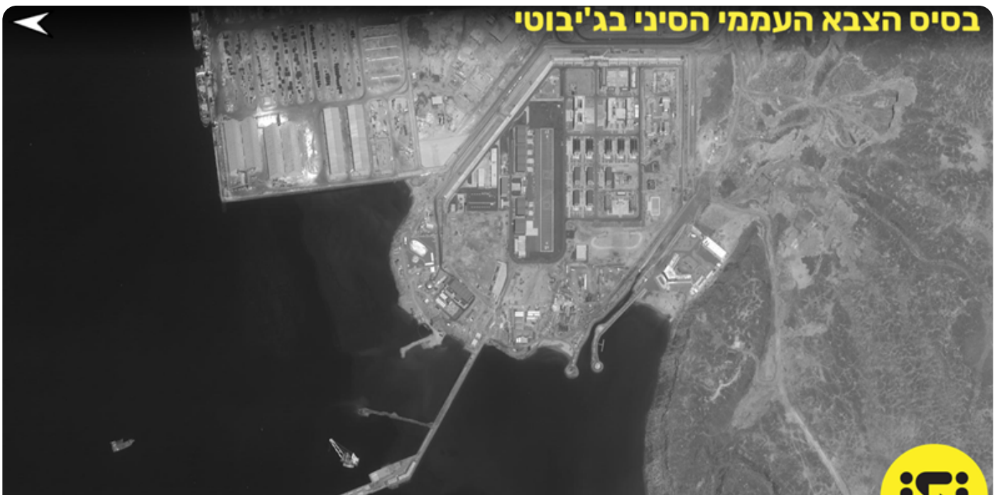
בסיס הצבא העממי הסיני בג'יבוטי.

השינויים שחלו באזור הים האדום במהלך העשור האחרון הביאו את הזירה לחוסר יציבות ולהתערבותם של כוחות חיצוניים, גלובליים ומהמזרח התיכון. גם לישראל אינטרסים במרחב ים סוף, ובעוד שהיא חותרת להסכמי שלום מול מדינות האזור, מומלץ כי תימנע מנקיטת עמדה בסכסוכים שאינה צד בהם