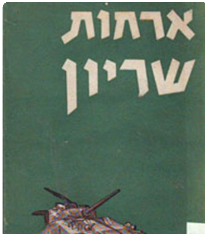
א. אילון, אורחות שריון, מערכות, תל-אביב, 1956, עמ' 7.

הפעלתם של כוחות השריון במשולב עם כוחות רגלים וכוחות ממערכי הסיוע הקרבי, באופן שממצה את יתרונותיהם ומצמצם את חסרונותיהם בהקשר למילוי משימה צבאית והשגת הישג מבצעי מוגדר, מחייב, לרוב, את הפעלת הטנקים בקרב תנועה ולא כעמדות אש מסייעת. לכן, המלצתי היא להדגיש את אימון כוחות השריון בתמרון שמטרתו להבקיע לעומק מערך האויב, תוך הסתייעות בכוחות רגליים לצורכי אבטחה ולטיהור מערכי האויב שנפרצו וכחלק ממאמץ המביא לגילוי האויב לכוחותינו. כמובן, יידרש להפעיל את מערך סיוע ההנדסה יחד עם כוחות השריון, על-מנת להבטיח את התמרון תוך איתור מכשולים, איתור והכשרת מעקפים, התגברות על מכשולים וכדומה. כל אלה יבוצעו מן הקרקע ומן האוויר ויסייעו ליצירת תמרון מהיר ותוקפני הדורס כל כוח הניצב מולו. הטנק הוא יצור התקפי, המביא לידי ביטוי בצורה הטובה ביותר את משמעותו של התמרון - תנועה ואש להשגת עמדת יתרון על האויב. על כן יש לחזק את תפיסת ההפעלה הכוללת תמרון משוריין וממוכן לעומק מערכי האויב, ערעור היערכותו, שיבוש שיטת פעולתו, חשיפתו כדי להשמידו ולהביא להכרעתו בכל מרחב בו פועלים כוחותינו. תפיסה זו אינה טובה רק בלחימה בתוך השטח הבנוי כפי שנעשה במבצע "צוק איתן" אלא נכונה, בהתאמה כמובן, גם לחזיתות אחרות הכוללות שטחים הרריים, פתוחים ובנויים בעלי ממדים גדולים בהרבה מזה של רצועת עזה.