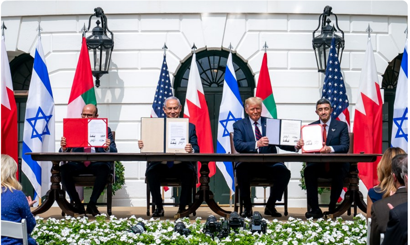
טקס חתימת הסכמי הנורמליזציה בין ישראל לבחריין ואיחוד האמירויות הערביות בבית הלבן, 15 בספטמבר 2020

מדיניות יעמדו שיקום המנהיגות של ארצות־הברית, פעילות פרו־אקטיבית להגבלת התחרות בין בנות בריתה המזרח־תיכוניות, לצד מעקב אחר כוונותיהן העתידיות של בייג'ין ומוסקווה.