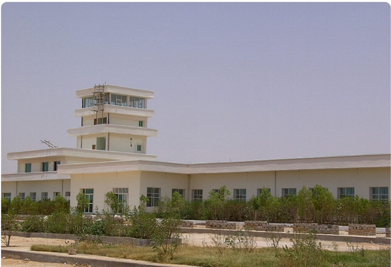
נמל התעופה הבינלאומי בבוסאסו, פונטלנד