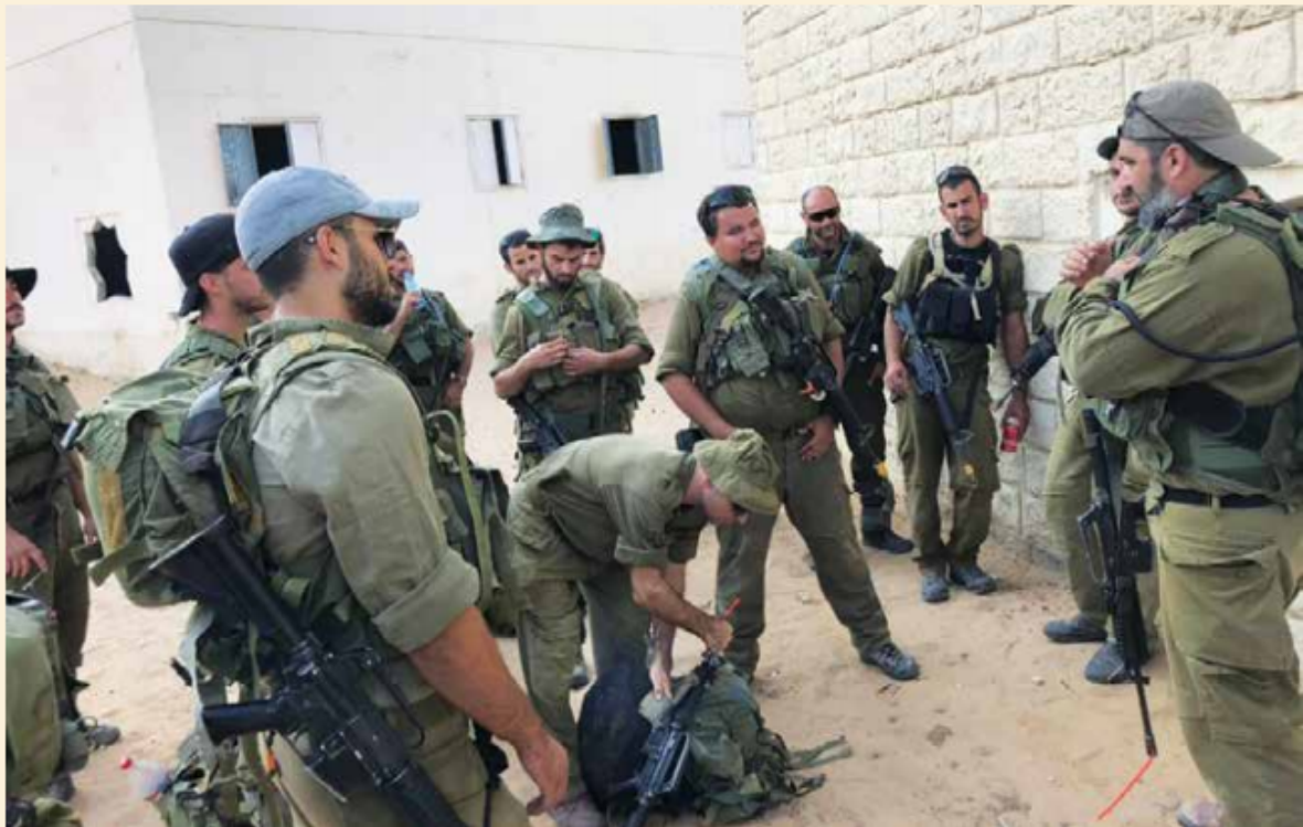
מפקד מקצועי נדרש לשתי תכונות שנובעות זו מזו: מיומנות והשתכללות מתמדת

העיסוק הצבאי הוא מקצוע המצריך מפקדים מיומנים ומקצועיים שיובילו את יחידותיהם לניצחון חד, ברור ובלתי מתפשר. עם מלוא ההערכה והכבוד לאנשי המילואים המשמשים כמג"דים, בשלה העת להחליפם באופן מדורג ושיטתי בקצינים סדירים, מנוסים ומקצועיים