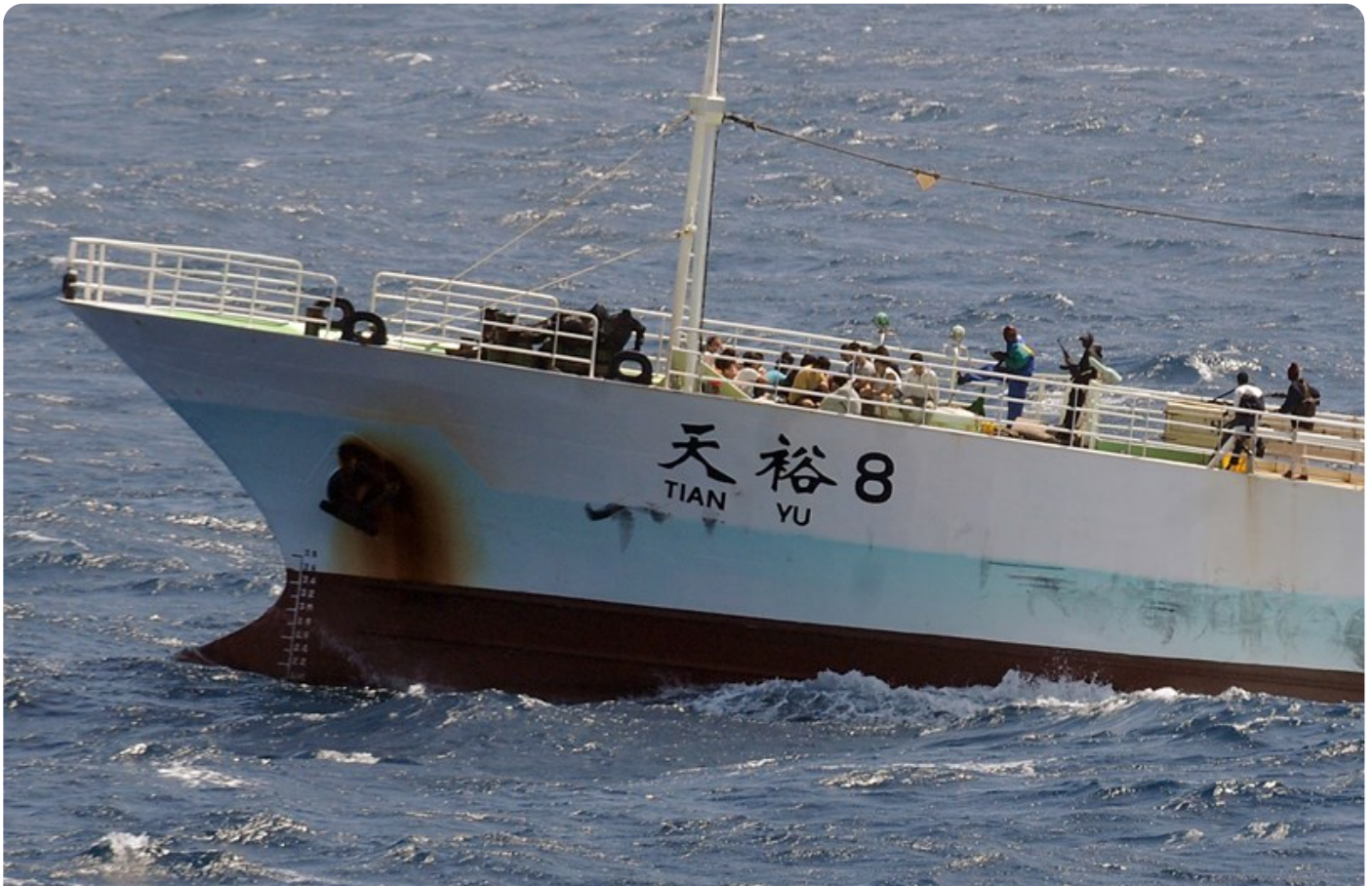
פיראטים סומלים חמושים מחזיקים על הסיפון בצוותה של אוניית הדיג הסינית "טיאני 8", 17 בנובמבר 2008

בעוד סוגי פעולות אלה פחתו מאז, 9 הרכב הכוח של הבסיס הסיני מרמז על טווח רחב יותר של משימות עתידיות פוטנציאליות, בין היתר משימות של כוחות מיוחדים, לוחמה אלקטרונית ולוחמת סייבר. בהיותו הבסיס הפעיל היחיד של חיל הים הסיני הרחק ממדינת האם, הוא מעורר דאגה בקרב האמריקנים שחושדים שהוא נועד להדגים את הרובד הצבאי של "יוזמת החגורה והדרך" של סין. הכוונות הצבאיות האגרסיביות שמיוחסות על-ידי האמריקנים לסינים בחלק זה של העולם טרם עמדו למבחן. אף על פי כן, הדרישה מן השחקנים האזוריים לבחור צד בין ארצות-הברית ובין סין גוברת ומוסיפה לחצים, עם פוטנציאל לפגוע באינטרסים אמריקניים (בראייה ארוכת טווח). 10