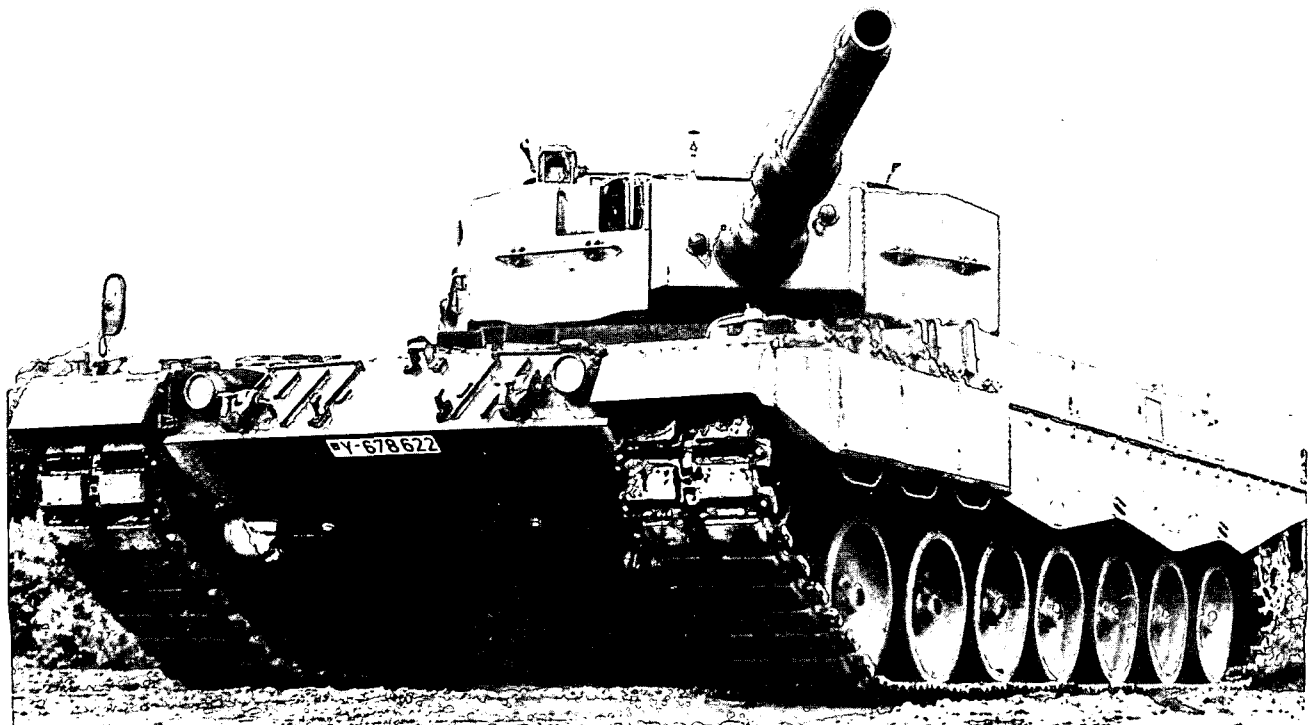
טנק "ליאומרד" (למטה) ונגמ"ש "מארדר" (משמאל)

באשר לאפשרות סטי"לים מתוצרת גרמניה יימכרו לה, יש לזכור כי ממילא אין הגרמנים מייצרים טילים ים-ים ולא תותחים 76 מ"מ, שהם החימוש הפופולרי לסטי"לים כיום. לפיכך, גרמניה תהיה שוב — כמו במקרה של מדינות המפרץ — זו שתספק את ספינת הסיור המהירה (הפלטפורמה) ויצרנים מחוץ לגרמניה יספקו את מרבית מערכות החימוש.