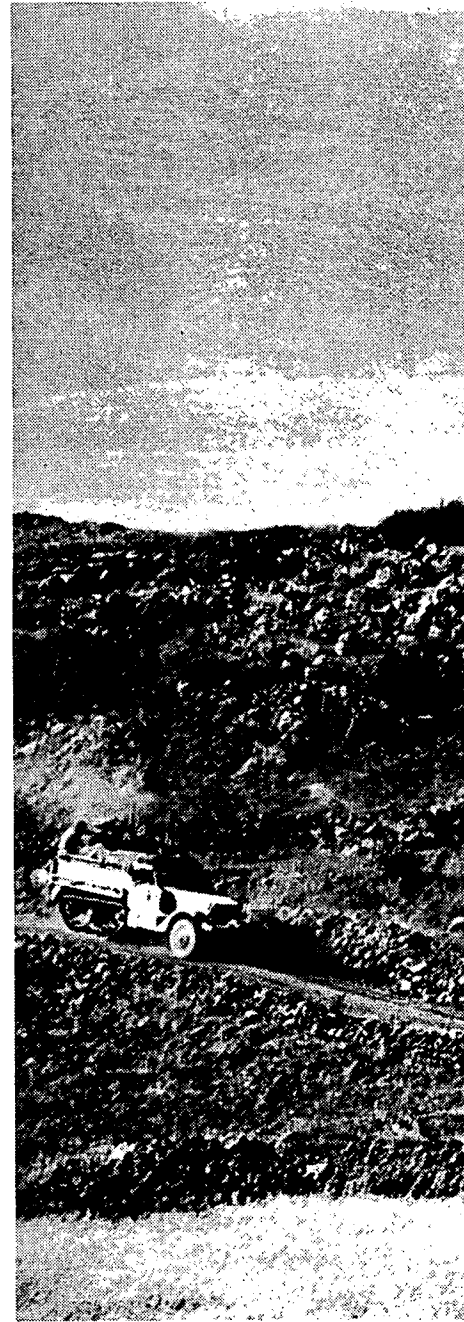
המלחמה המקדימה, המתקפה, והעברת

לידי ביטוי מכלול המרכיבים והשיקולים המונחים ביסודה של תורת ביטחון זו: המלחמה המקדימה, המתקפה והעברת המלחמה לעומק שטחו של האויב, הכרעת סער (לא שחיקה) ומלחמה קצרה. בין מלחמת ששת הימים למלחמת יום הכיפורים נקלענו לדיכטומיה: מצד אחד זכינו בעומק אסטרטגי שכל-כך נכספנו לו, ושבלעדיו היינו תלויים בהתרעה המודיעינית, בחיפוי האווירי, בהגנה המרחבית, במכונת הגיוס, במלחמה המקדימה, במתקפה ובמעבר מהיר לעומק שטחו של האויב. אבל מצד שני, השטחים שנכבשו לא נועדו לשמש רק כעומק אסטרטגי