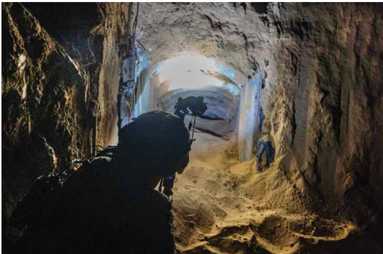
פיר מנהרה שהתגלה בעזה. צה"ל לא השכיל לבנות כוח משמעותי, בסד"כ אוגדתי, הנותן מענה לדרג הצק"ג לכמות הפירים שהתגלו.

ברמת הגדוד לחשיפת איום מסוג זה ולסיכולו? אם איום זה כה רחב, בצורה שלא הפתיעה איש, מדוע לא נבנה הכוח המתמרן באופן שייתן מענה אינהרנטי לאיום זה?