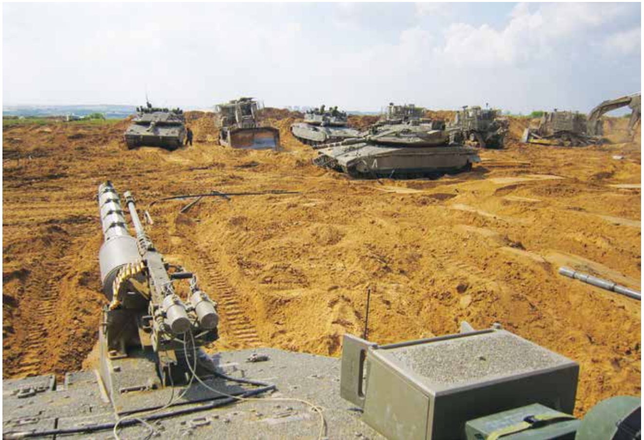
מגן בעזה במהלך "חרבות ברזל". באבטחת המגנים לא היה כלל שימוש במכ"מים טקטיים, שלהם יכולת כיסוי רחבה.

ואינן תמיד מועילות. מבחינת נוהל הקרב, ניכר היה במהלך כל המלחמה כי הכוח שעתיד להיכנס לתמרון מאפשר לכוחותיו עד דרג הגדוד והפלוגה לבצע נוהלי קרב סדורים וממושכים, שאפשרו את מיצוי המודיעין שנצבר על היעד והורדת פקודות סדורה. לעומת זאת, קרבות טיהור המרחב, שכללו הן התקפות והן פשיטות, הן "אלמנות קש" והן מארבים, וכן הפעלת אש וסנכרון פעולות בין כוחות סמוכים, נערכו על פי רוב בנוהל קרב חפוז למדי. נוסף על כך, האויב אומנם נערך נגדנו כמערכת, אך מרגע שהשטח כבר חווה התקפה וטיהור, קשה לומר כי התנהלותו המשיכה להיות כמערכת. נראה שהוא החל להתפרק לגורמים המתפקדים זה בנפרד מזה. בנוהל הקרב, טרם התחלת ההתקפה, ברור כי המנהור הוא חלק ממערכת פלוגתית או מחלקתית שבמרכזה המארב, אך עם תחילת התמרון וכתישת התשתיות הידועות, הרי שהמכלול שנשאר בידי האויב, והאויב שנשאר כדי להשתמש בו, אינו מנוהל ריכוזית ואינו מהווה מערכת כי אם אוסף פריטים המשתמש במה שנותר לו בצורה הטובה ביותר מבחינתו. יתרה מכך, בקרבות ההתקפה הראשונים לתוך שטח הרצועה לקראת סוף אוקטובר, אפשר היה לראות כי האויב מממש לחימה רב ממדית קלסית, לרבות שימוש באש מותנית מסייעת תמרון, שימוש ברחפנים לתצפית ולהתקפה וחידוש מלאים