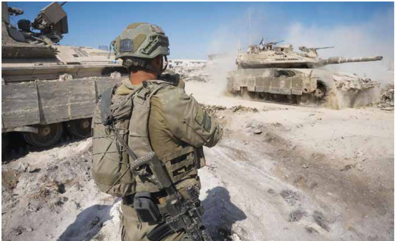
כוח של צה"ל בעזה ב"חרבות ברזל". בשנים שקדמו למלחמה החל צה"ל להנחיל בהדרגה לדרג המתמרון תפיסות חדשות לניסוח המשימה ולהגדרת האויב.

שלב טיהור המרחב ברמת הגדוד והחטיבה הוא השלב המשמעותי, הארוך, הסיזיפי והמאיים ביותר לכוחותינו בקרבות מלחמת "חרבות ברזל". למרות זאת, מערכת ההכנות שנעשתה אליו בהקשרי בניין הכוח והרכבו, באימונים, במודיעין ובכשירויות הפרט והצק"ג היו לקינות, ולא תאמו את הנדרש מאיתנו בלחימה