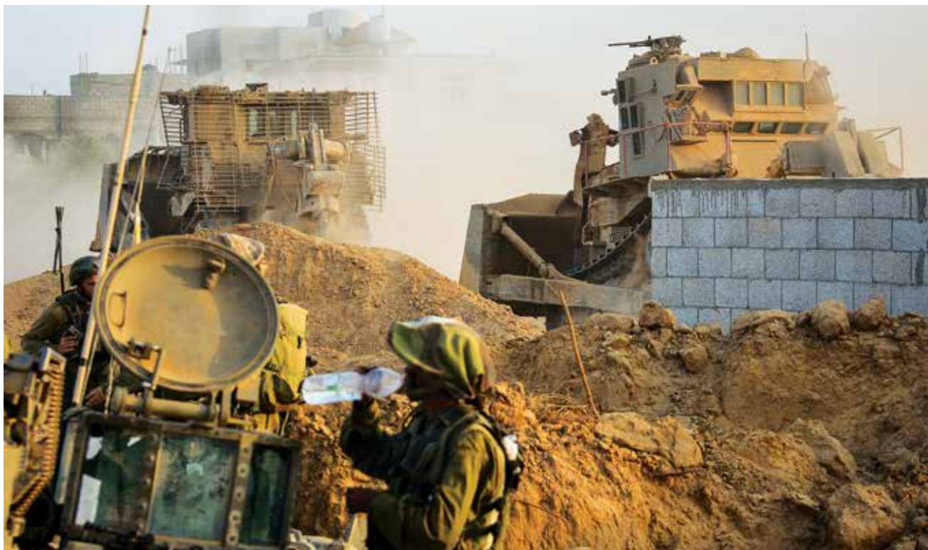
דחפורי D9R ו-D9N משוריינים מורצים ציר במהלך התמרון הקרקעי ב"צוק איתן". תמרון מוגבל כפי שבוצע בזמנו, הביא ל"התקפה" בת דקות אחדות ושיטוט של שבועות ארוכים בחיפוש אחר פירי מנהרות, מפקדות ותשתיות אחרות.

ל"התקפה" בת דקות אחדות ושיטוט של שבועות ארוכים בחיפוש אחר פירי מנהרות, מפקדות ותשתיות אחרות. עתה, בחלוף חודשים רבים של תמרונים במסגרת "חרבות ברזל", אפשר לבחון תפיסה זו לעומק.