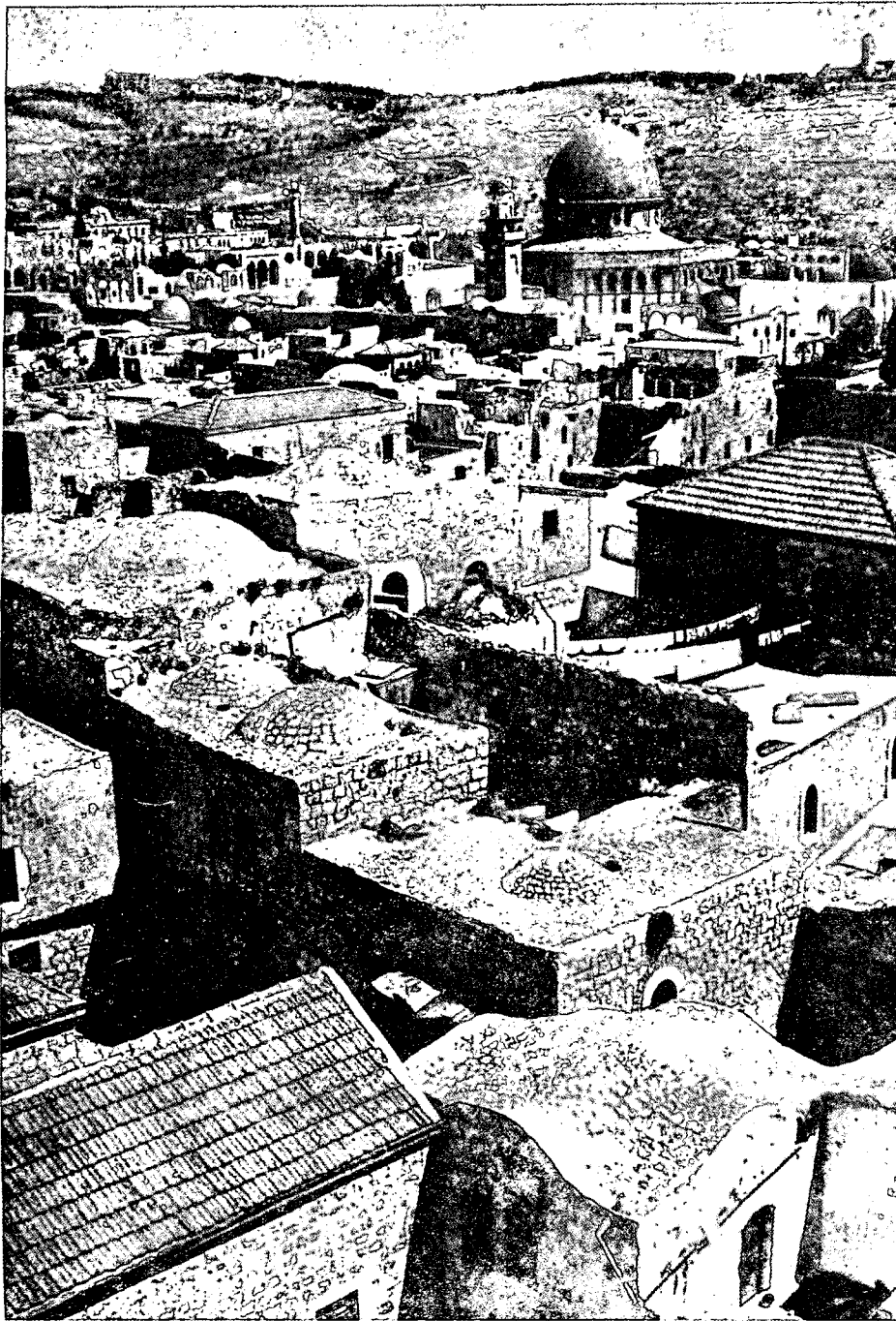
הרובע היהודי — מראה כללי