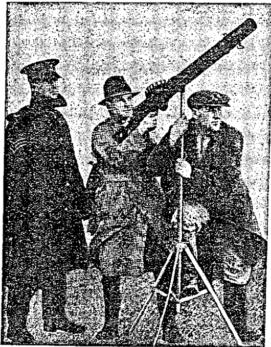
מועל בחדר מהפלוגות האנטי-מטוסיית "הקלות" להגנת מפעלים