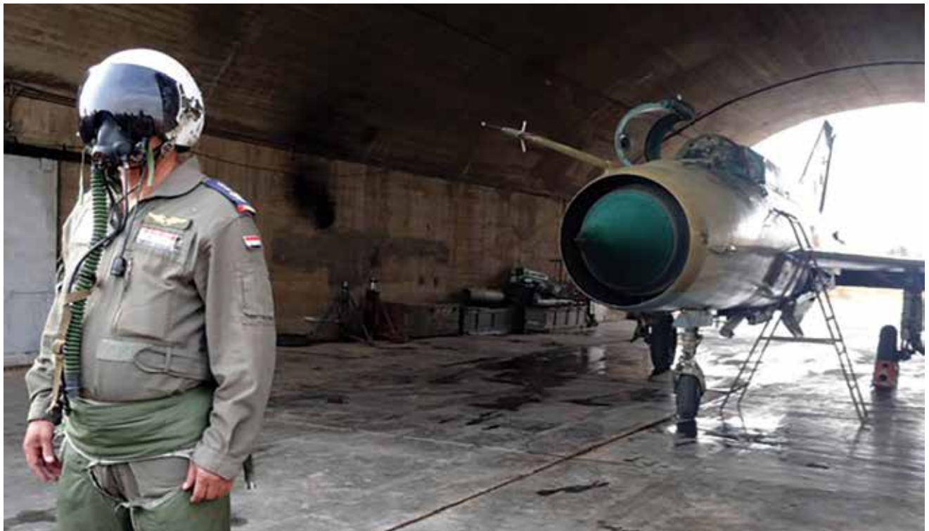
טייס סורי. בחזית המערך הוצבו כוחות רבים ודלי חתימה, הלוחמים באופן א-סימטרי

פריצתו. מיומנות הכוחות המיוחדים במשימות הנחתת סער עשויה הייתה לאפשר להם להשתלב במהלך מוגבל או מלא מול ישראל. סביר להניח שהיתרון שהסורים ייחסו לכוחות המיוחדים הוא היכולת לקדם בחשאי, וכך להשיג הפתעה בפתחת המערכה. כמו כן, כוחות אלה יכלו להפעיל אמצעי נ"ט נגד השריון הצה"ל.