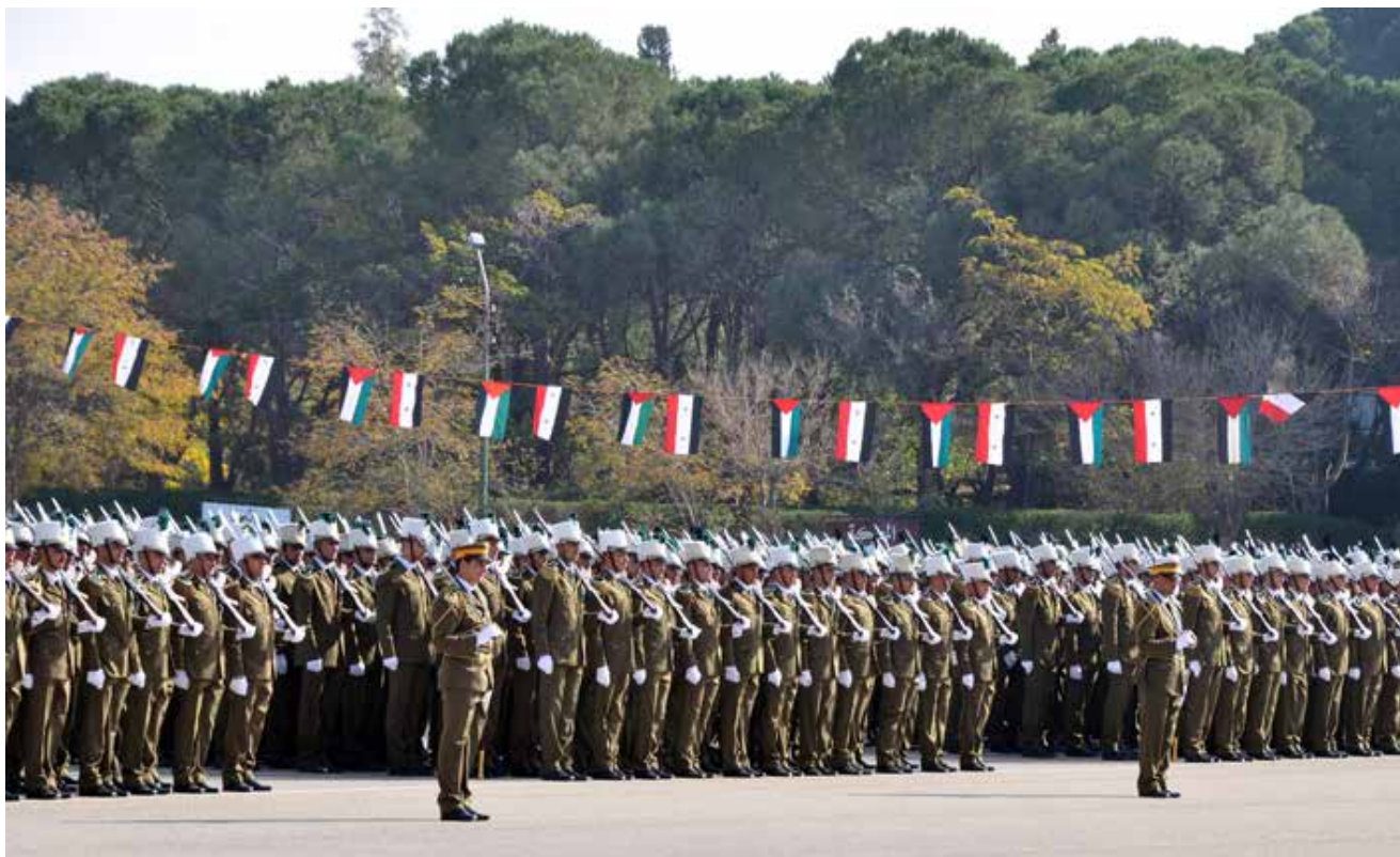
מסדר סיום קורס קצינים סורי. בעיתות חירום הסתמך הצבא הסורי על גיוס מילואים, גם לצורך הפעלת יחידות סדירות