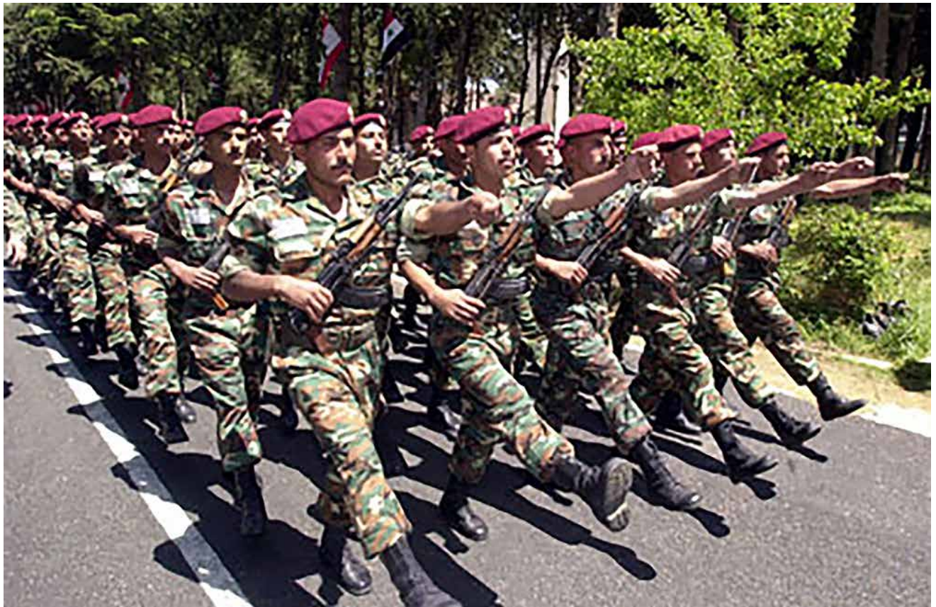
חיילי צבא סוריה באימון. סוריה ראתה את המלחמה נגד ישראל כרצף מערכות

במרס 2011 היה צבא סוריה ערוך להגיב להתקפה ישראלית מרמת הגולן, ובמקרה הצורך גם להתערב בלחימה שבין צה"ל ובין חזבאללה. מאמר זה בוחן מה היו תרחישי הייחוס של הצבא ערב המלחמה, מה הייתה תפיסת המערכה שלו וכיצד הוא נערך ליישמה. על בסיס הידע והמסקנות אפשר יהיה לבחון את השינויים בתפיסת המערכה הסורית במהלך מלחמת האזרחים ואחריה