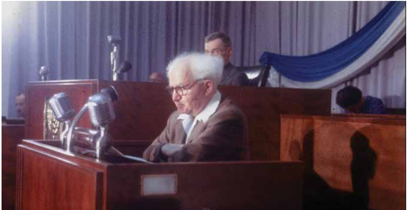
דוד בן-גוריון בכנסת, ינואר 1957. הראשון שטבע את השימוש במילה "ממלכתיות" במונח המוכר כיום.

הממלכתיות נמצאת בימים אלה במרכזו של השיח הציבורי במדינה. הפיקוד הממלכתי, כנגזר מיישום ערך היסוד "ממלכתיות", נדרש מכל שדרת הפיקוד בצבא. מן הראוי שכל מפקד בצה"ל יישם את מודל הפיקוד הממלכתי כחלק מובנה מהכלים ליישום מקצוע הפיקוד הצבאי בכלל, וערך יסוד הממלכתיות בפרט