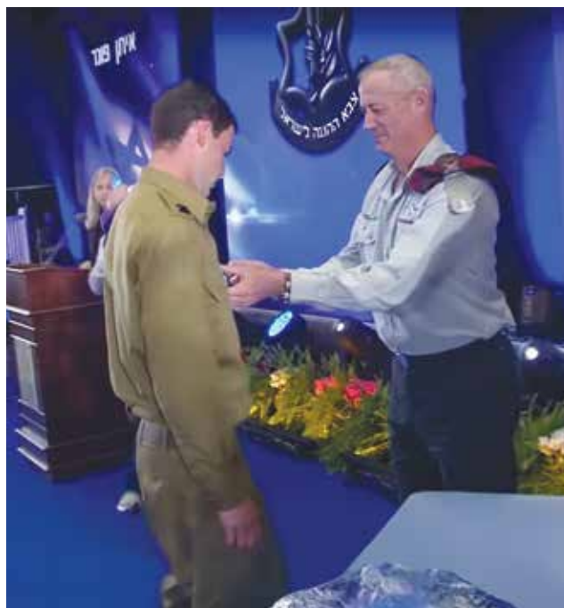
"בעוז רוחם": טקס הענקת צל"שים ועיטורים ללוחמי מבצע "צוק איתן". הדרישה מהמפקד למילוי תפקידו באופן ממלכתי קבועה ומתמשכת ביום-יום ובמהלך כל הקריירה הצבאית (אילוסטרציה).

בניגוד לבעלי מקצוע במוסדות ובארגונים ממלכתיים שונים, שיכולים לבחור לעבוד במקצועם במסגרות פרטיות אשר אינן מחייבות אותם בממלכתיות, בפני קציני צה"ל לא ניצבת בחירה זאת. הדרישה מהמפקד למילוי תפקידו באופן ממלכתי קבועה ומתמשכת ביום-יום ובמהלך כל הקריירה הצבאית. יתרה מכך, הבחירה בתפקידי פיקוד בצבא מקפלת בתוכה את המחויבות להתנהלות ממלכתית 24 שעות ביממה, שבעה ימים בשבוע. במובנים מסוימים, קצין בצה"ל נדרש להתנהלות ממלכתית גם בזמנים שבהם אינו לובש מדים ואינו פוקד על חייליו. אלוף (מיל') אלעזר שטרן היטיב לנסח דרישה זאת בעת היותו אחראי לשערי הכניסה לקצונה כמפקד בה"ד 1. הקצין בצה"ל, לשיטתו, הוא "קצין ללא הפסקה" 3 . מעת לעת נסקרת מידת אמון הציבור 4 במוסדות המדינה באמצעות גופים חיצוניים, דוגמת המכון הישראלי לדמוקרטיה. אמון הציבור בכל מוסד ומוסד משתנה בהתאם לתפיסת הציבור את התנהלות הארגון. אחת הדרישות המשמעותיות ביותר של הציבור מצבאו כדי לתת בו את אמונו היא כי הצבא, על מפקדיו ותתי-ארגוניו, יפנים את דרישות הממלכתיות ויקיימן. הרמטכ"ל לשעבר רא"ל (מיל') גדי איזנקוט הרבה להדגיש כי אמון הציבור במערכת הצבאית הכרחי לתפקודו של הצבא. איזנקוט אף טען שהאיום הגדול יותר על צה"ל אינו איום מחוץ, אלא מצב של אובדן אמון הציבור הישראלי בצבאו. 5 הדרישות התובעניות של מפקדים בצבא מפקודיהם, בשגרה ובוודאי במצבי חירום ומלחמה, מחייבות רמת אמון גבוהה של החיילים במפקדיהם כדי להבטיח את תפקודה התקין