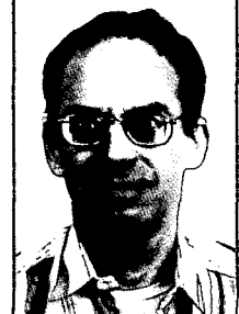
חוקר היסטוריה צבאית ישראלית

בשני תחומים היא מאוימת הרבה יותר: הנשק הבלתי קונוונציונלי ו ה ט ר ר . נשאלת איפוא השאלה מהי תרומת הגדה המערבית והגולן לביטחון ישראל מפני