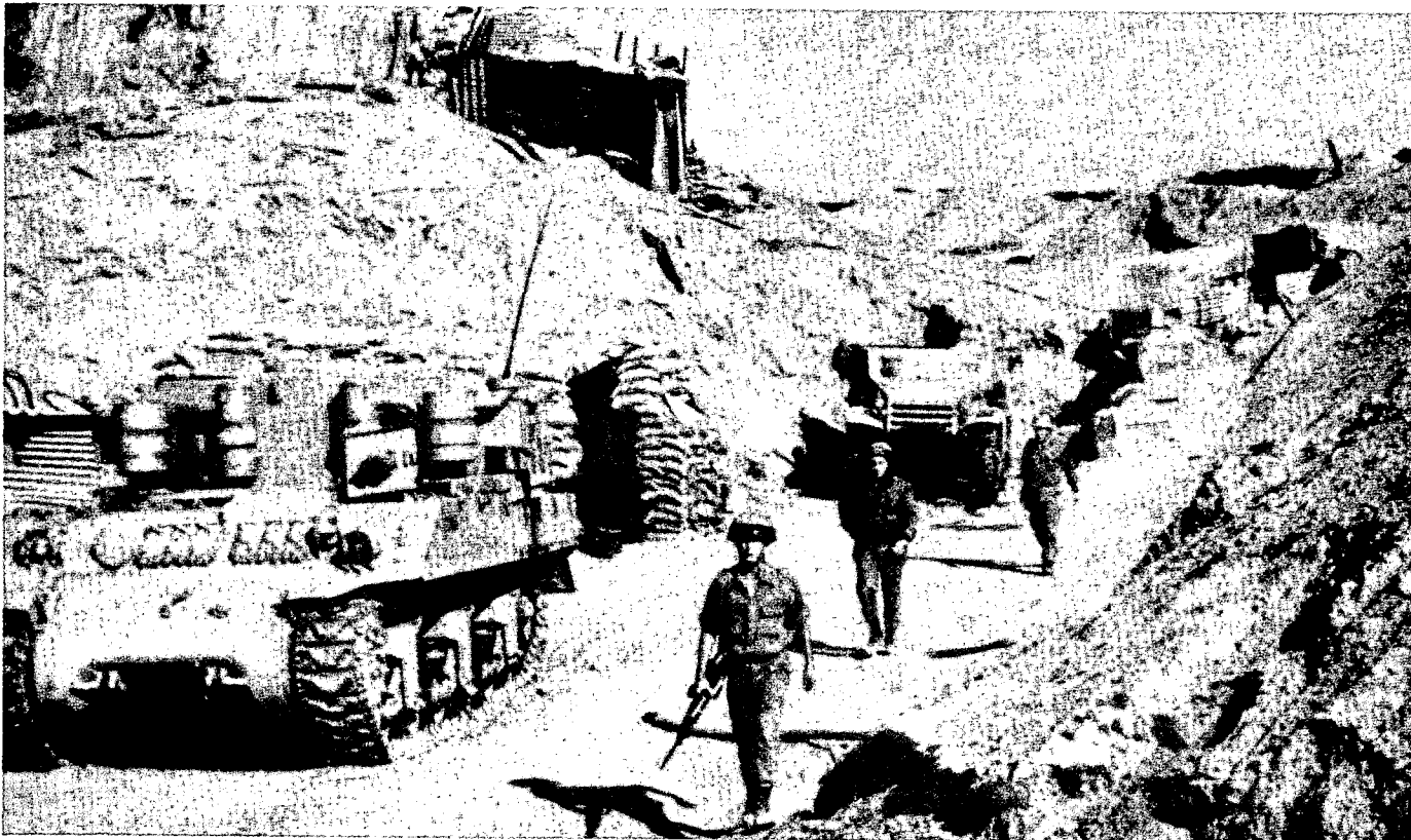
גוז בקו תעלת סואץ. לפני מלחמת יום הכיפורים נסגרו מספר מעוזים מבלי שיימצא להם תחליף.

תחושתי היא שמלחמת יום הכיפורים לא הייתה כורח היסטורי וגם אם אי אפשר היה להגיע לשלום נוסח קמפ-דייווד אפשר היה אולי להגיע למניעת מלחמה. ניתוח זה חשוב, כיוון שגם היום יש טוענים שמלחמה נוספת עם הסורים היא כמעט בלתי נמנעת — ואילו לדעתי צריך, ואפשר, לנקוט צעדים שיפריכו הערכה זו — ומלחמה נוספת עם הסורים — תימנע.