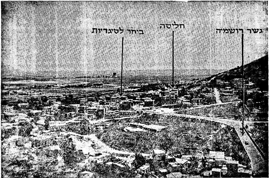
תצלום חליטה וסביבתה כיום כפי שהיא נראית חצד מערב.

לו, שבאתי עם קבוצת-הגנה לשמש כמפקד המקום. שמחתו היתה רבה. השארתי את החברה באחד הבתים, ויצאתי אתו לסייר את השכונה שהיתה כבר שרויה בחושך. הוא הראה לי את המשמרות שארגן, וסיפר לי שהנו בעל נסיון קרבי, כי השתתף במלחמת רוסייה-יפן. לעתים קרובות היה עובר בשיחתו לשפה הרוסית. התברר, כי בכל השכונה נמצאו שני אקדחים קטנים. בקשתיו לא לדבר בקול רם וללכת בשקט. רציתי להתרכז, ללמוד את הסביבה, להרגיש אותה. בסיוור בררתי, שהמקום שהוטל עלינו להגן עליו, הנו קבוצת בתים קטנים ובית אחד גדול, בעל קומה וחצי. השכונה שוכנת על מדרון הרר-הכרמל (למעלה ממנה, על הפסגה, נמצאת השכונה נהד-שאנן), מימין לדרך נצרת. ממולה — ביהח"ר הערבי לטיגריז קארמאן, ועוד כמה בתים ערביים גדולים. לעבר מערב, לצד חיפה, גובלת השכונה בבתיים ערביים קטנים, "חושות" (שתושביהם עזבו אותם). בינה לבין ואדי-רושמייה שטחים ריקים, ולא הרחק ממנה עובר במדרון ההר ואדי קטן שעומקו עד חזה-איש. בין השכונה ונהד-שאנן שמעליה מבדיל מדרון דייחלול, סלעי וחשוף. רק ע"י השכונה גדלו כמה עצי-חרוב. מזרחה ממנה הבדיל שדה-טרשים