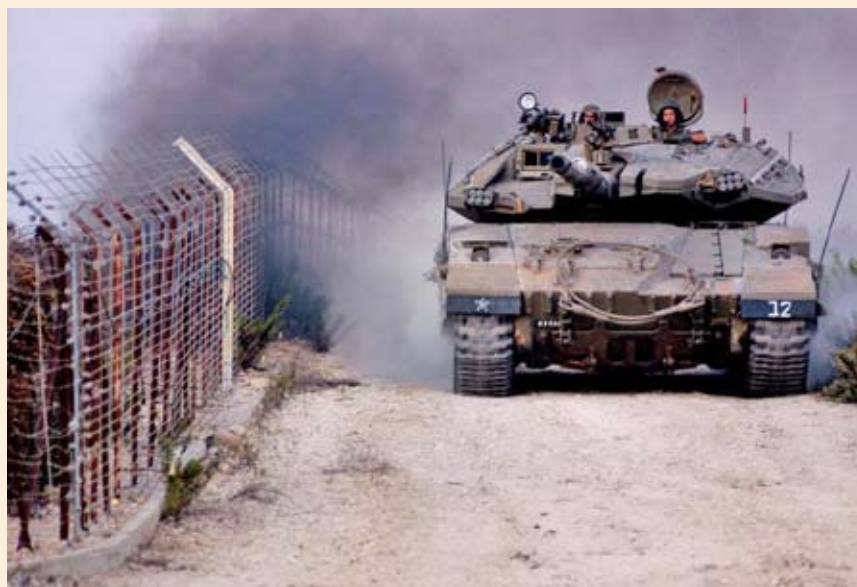
כוחות שריון במהלך מלחמת לבנון השנייה. הטעות שעשיתי אל מול התכנון האוגדתי, הייתה בחירת ציר ההתקדמות לחטיבה במעלה הדרך מהמעבר בסלוקי לכיוון ע'נדוריה

לדעתי, הטעות במינוי אלופי המילואים להובלת התחקירים הובנה, ולא נעשתה במערכות הבאות וטוב שכך. אני סומך על הרמטכ"ל ועל מפקדי צה"ל האחרים, שהם מקיימים את התחקירים ללמידה איכותית ולהפקת לקחים בה הכרחיים.