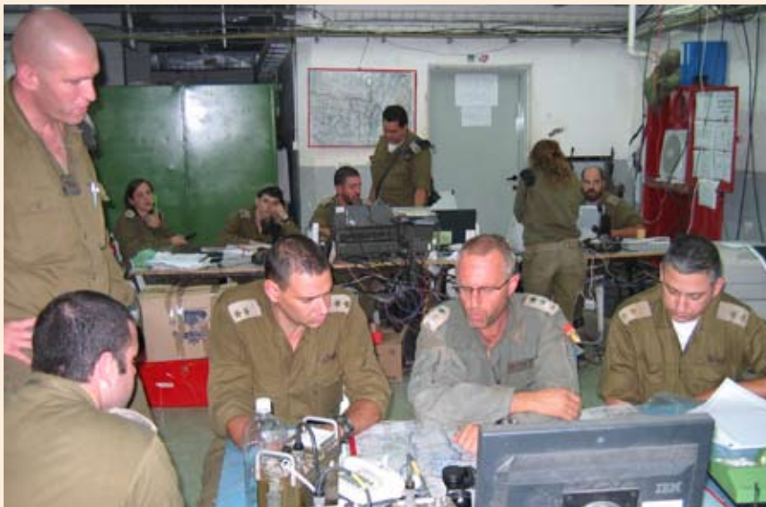
לאחר החזרה מהקרב בסלוקי בחפ"ק החטיבתי. בתחקיר עוצבת הפלדה, לא קוימו שלבי התחקיר הבסיסיים בצורה מקצועית ופתוחה