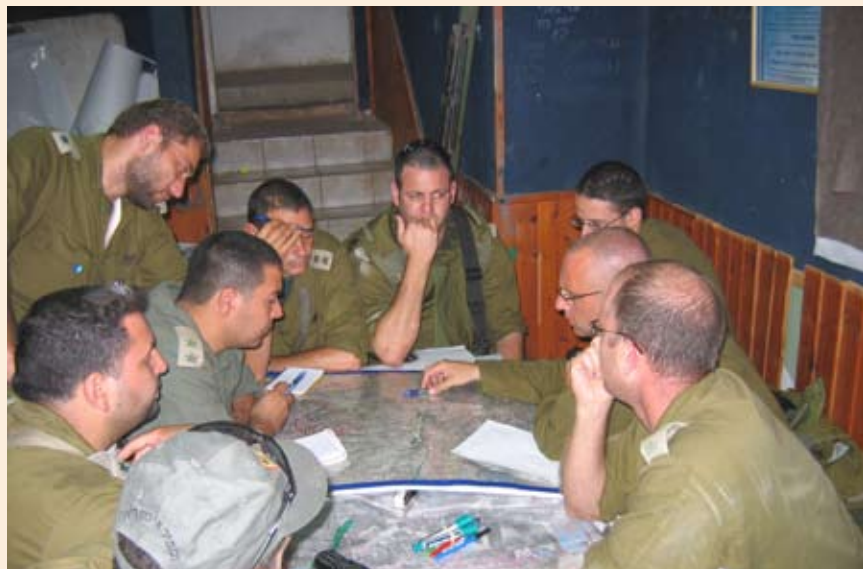
אישורי תוכניות בחפ"ק בצפון. תמונת מצב המודיעין הייתה כללית ביותר, כמו בכל שלבי המלחמה

מבצע "שינוי כיוון 11", היה מהלך התקפי-פיקודי וחטיבה 401 לחמה בו תחת פיקוד עוצבת הפלדה. מטרת המבצע הייתה להפחית באופן משמעותי את ירי התמ"ס לשטח מדינת ישראל, ולהשיג שליטה על מעברי הליטני תוך פגיעה במקסימום מחבלים. תמונת מצב המודיעין הייתה כללית ביותר, כמו בכל שלבי המלחמה. ההבנה הייתה שחזבאללה מתארגן כתוצאה מן ההפוגה בלחימה, ותמונת המצב של המודיעין הייתה שאין תגבור כוחות אויב ברס