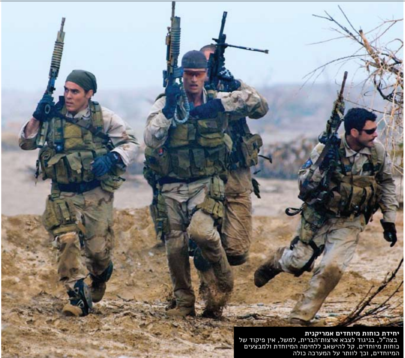
יחידת כוחות מיוחדים אמריקנית בצה"ל, בניגוד לצבא ארצות הברית, למשל, אין פיקוד של כוחות מיוחדים. קל להשאב לחימה המיוחדת ולמבצעים המיוחדים, וכך לוותר על המערכה כולה

▶ שניהם היו היינו הך – תחנות אפקטיביות לקידום מהלכים שלפיהן פעל, נעסוק בשני ציטוטים חשובים מדבריו וננסה פוליטיים, בתוך הצבא ומחוצה לו.