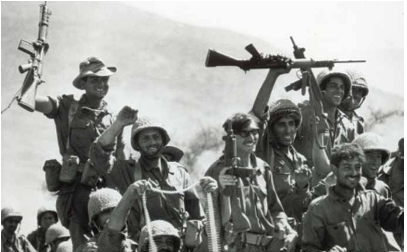
צה"ל במלחמת ששת הימים | לעוצבות המילואים היה חלק מרכזי בניצחון במלחמת ששת הימים - במיוחד בחזית המרכז ובחזית הצפון

המילואים - על אף המגבלות האינהרנטיות שלו - גורם משמעותי בחוסנה ובעוצמתה של ישראל, והוא התמיד להתייבב נוכח כל אתגר ביטחוני, אף שרבים מאנשיו השתתפו שוב ושוב בתנועות מחאה שונות. מהסקירה הזאת גם ניתן ללמוד מהם המשתנים שמשפיעים בעקביות על המוטיווציה של אנשי המילואים: 1. תחושה של איום ביטחוני או התפתחות של מצב חירום היו בכל מהלך ההיסטוריה של ישראל גורמים שחיקו מאוד את המוטיווציה של אנשי המילואים להתייבב לשירות ולהילחם. 2. הנכונות להתייבב למילואים לא הושפעה באופן מהותי מזעזועים וממשברים בתוך החברה. 3. היעדר אימון לצד גיוס מאוחר השפיעו באופן שלילי ביותר על המוטיווציה של חיילי המילואים ותרמו להתארגנותן של מחאות שאותן הובילו אנשי מילואים. 4. ניתן להתרשם שגמול והוקרה משפיעים על המוטיווציה להתגייס, אך לא באופן מהותי.