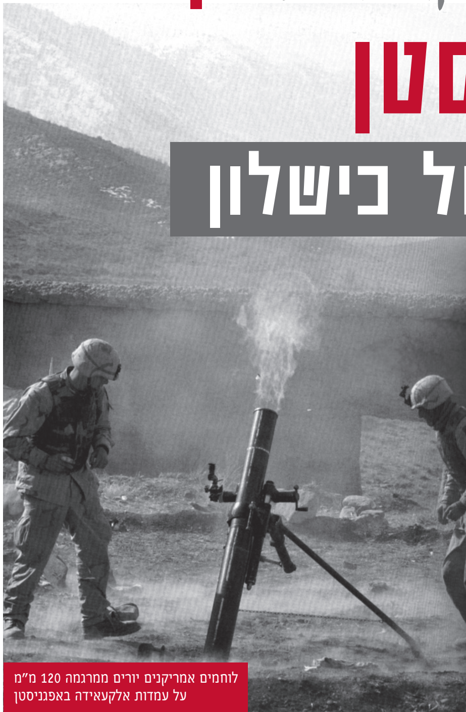
לוחמים אמריקנים יורים ממרגמה 120 מ"מ על עמדות אלקעאידה באפגניסטן

הספר "יום שלא טוב למות בו" מתאר את מבצע "אנקונדה" שביצע צבא ארצות הברית באפגניסטן כמה חודשים לאחר פיגועי 11 בספטמבר. ספר זה מעניק הזדמנות להתבוננות מעמיקה ומרתקת, ולקחיו יכולים לשמש חומר למידה חשוב עבור מפקדי צה"ל