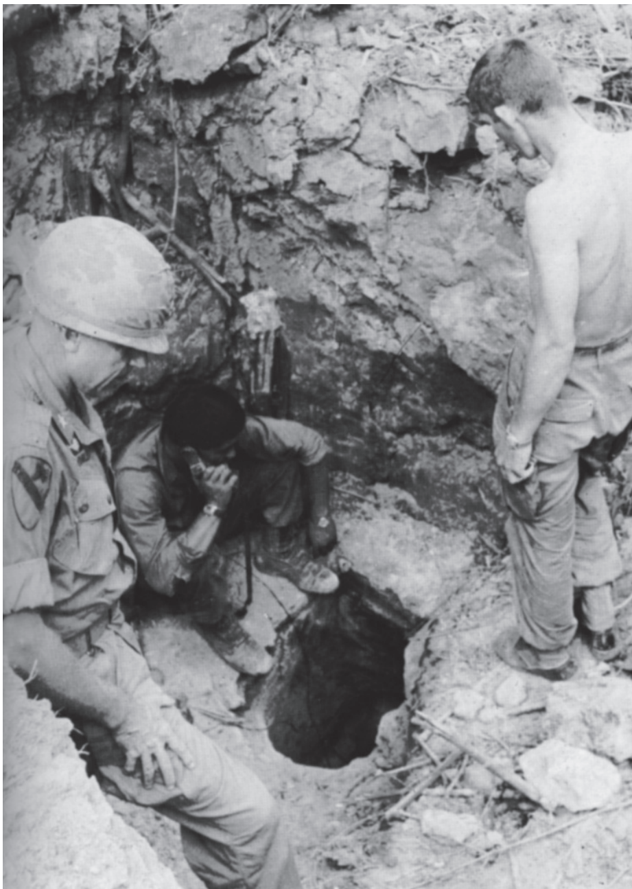
פתח מנהרה שחשפו כוחות אמריקניים | המנהרות פוצצו בדרך כלל באמצעות דחיסת גז אצטילן למערכת המנהרות ופיצוצו

בסיס הדרכים והמנחתים שהוכנו במסגרת מבצע CEDAR FALLS כדי לא לאפשר לווייטקונג להפוך שוב את אזור קר-צ'י לבסיס מרכזי. כאמור, מערכת המנהרות כולה נחשפה סופית רק ב-1972. לחשיפה היה אחראי צבא דרום-וייטנאם, והיא נעשתה במהלך הדיפתה של מתקפת הפסחא של הווייטקונג. בחשיפתו של כל מערך המנהרות ב"משולש הברזלי" הסתייע צבא דרום-וייטנאם במידע מודיעיני שהגיע לידיו מסייענים של הווייטקונג וכן בהפצצות כבדות של חיל האוויר האמריקני.