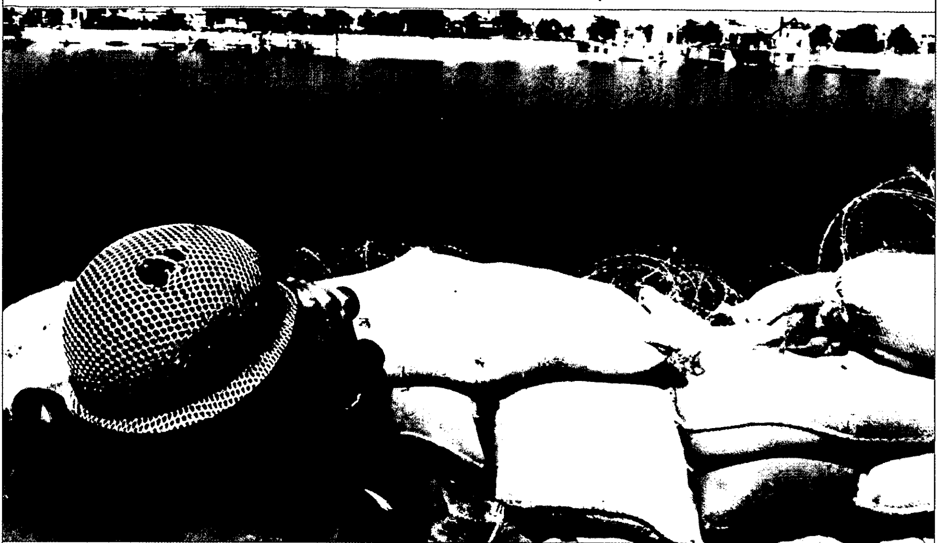
ישנן מסקנות שאיבדו מהרלוונטיות שלהן. דוגמה בולטת לכך היא ההמלצה לרכז את התצפיות ביחידה מטכ"לית כלקח מהנתק שנוצר בין תוצרי התצפיתנים הקרביים לאורך התעלה וברמת הגולן לבין ראשות אמ"ן

לבצע שינויים מהותיים ויסודיים במבנה אמ"ן וחיל המודיעין, שיתנו ביטוי נאות ואף עידוד לדעות שונות נוגדות בקרב עובדי מחלקת המחקר בהערכות אמ"ן המופצות לגורמים שונים."