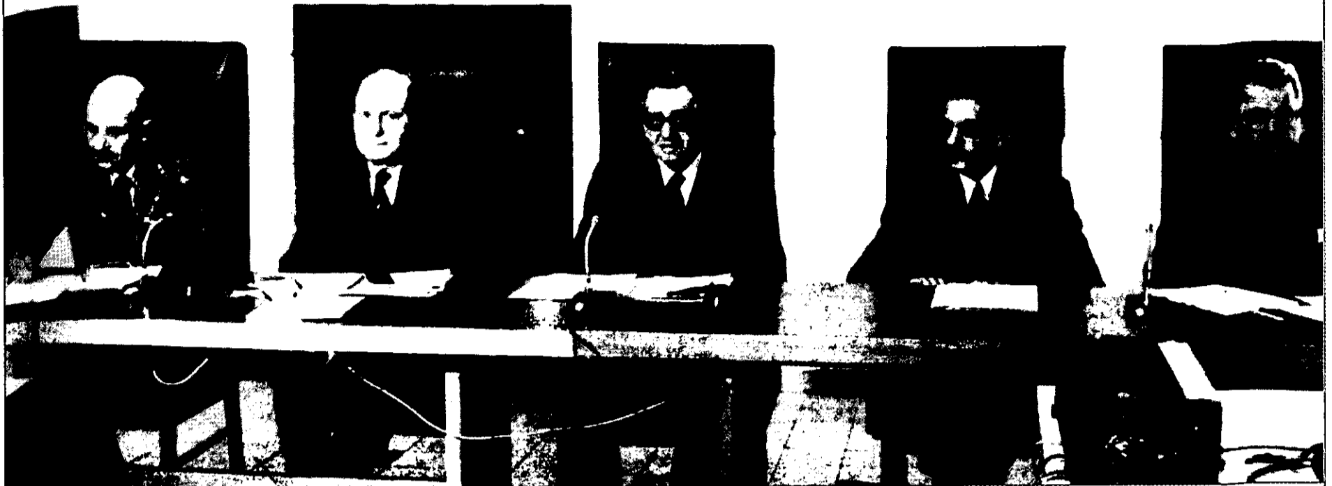
"השיח האגרנטי" בוחן את עבודת המודיעין בעיניים משפטיות המגדירות את כללי המותר והאסור ומשיתות עונשים על מי שאינו נוהג לפיהם

העוסקת בהצלחותיה ובכישלונותיה, ויש לבחון אירועים בראייה שלמה המביאה בחשבון את כלל העשייה. אמ"ן לא יוכל לעשות כן כל עוד לא ישתחרר ממאפייני השיח הזה.