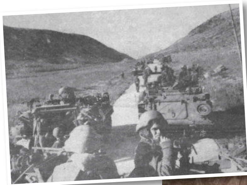
כוחות הצנחנים שבים לישראל בסיום הפעולה. מימין: סרן גל הירש