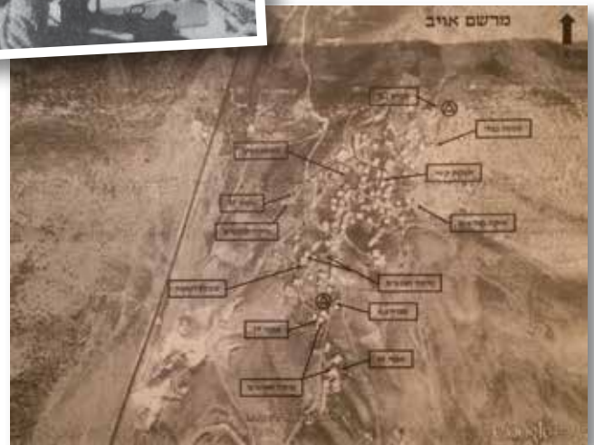
תצ"אות של הכפר מידון. חזבאללה סילק מן הכפר את מרביית תושביו, והפך אותו ליעד מבוצר

מבצע "חוק וסדר": מטרתו הייתה פגיעה בפעילות ארגון חזבאללה, פגיעה במחבלים והשמדת תשתית פח"עית באזור מידון