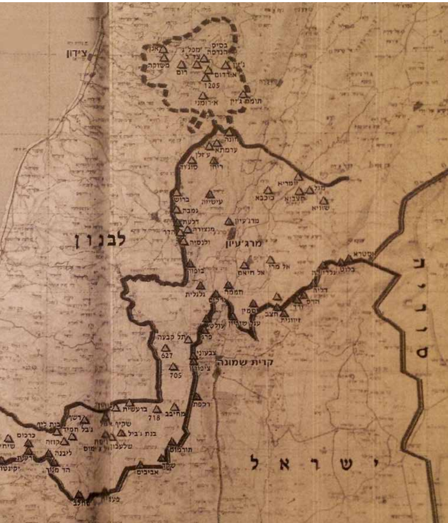
אזור הביטחון ומובלעת ג'זין. חזבאללה נמנע מלהקים בסיסי פעולה בכפרים שאינם מושבים, והחל לפעול מלב האוכלוסייה האזרחית השיעית בדרום לבנון, המשמשת לו מקור תמיכה