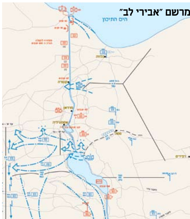
במלחמת יום הכיפורים ביצע פיקוד הדרום תמרון גישה עקיפה לידל הארטי קלסי. בהתאם לתפיסה הזאת, חיפשו כוחות צה"ל את נקודות התורפה במערך ההחזקה של קו ההגנה המצרי. נקודת תורפה כזאת נמצאה בתפר שבין שתי הארמיות המצריות, ולכן הבקיע צה"ל את מערך ההגנה המצרי בנקודה הזאת, ותמרן במהירות לעומק כדי לכתר את הארמיה השלישית (מפה: אביגדור אורגד)

הרעיון המבצעי של תוכנית "אורנים גדול" במלחמת לבנון הראשונה היה גם הוא תחבולני, ושמן בחובו שני יתרונות אפשריים בתוצאה הסופית. התמרון העיקרי, בהתאם לגישת לידל הארט, היה של אוגדה 162 שחדרה לעומק השטח בין מערך ההגנה הסורי בבקעת הלבנון ובין מערכי ההגנה של המחבלים בדרום לבנון ובאזור החוף. היעד המערכתי של האוגדה היה כביש בירות-דמשק. <