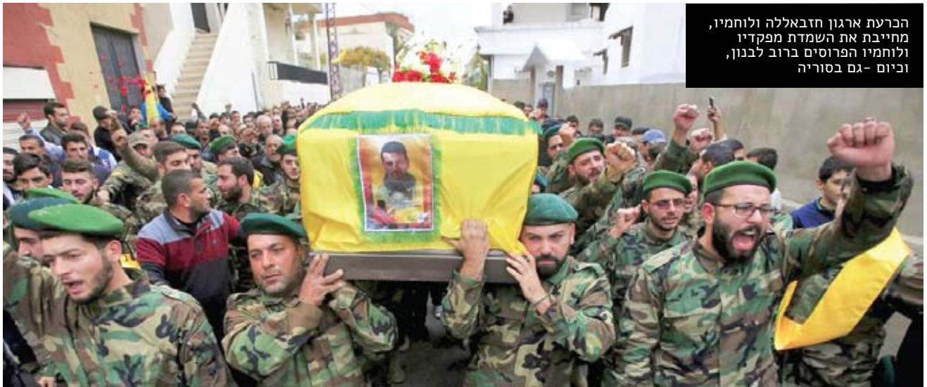
הכרעת ארגון חזבאללה ולוחמיו, מחייבת את השמדת מפקדיו ולוחמיו הפרוסים ברוב לבנון, וכיום - גם בסוריה

מבחינה צבאית, לא ברור אם המחיר מבחינת משאבים (בדם ובממון) מצדיק זאת. כך, לדוגמה, הכרעת ארגון החזבאללה מחייבת על פניו את השמדת מפקדיו ולוחמיו הפרוסים ברוב לבנון (וכיום - בשנת 2016 - גם בסוריה). כדי להגיע לכלל אנשי החזבאללה, הנוקטים טקטיקת היעלמות, יהיה על צה"ל להשתלט ולטוהר את המרחב", כלומר, את כל מדינת לבנון. זאת עוד לפני שעסקנו בצורך בבידוד מוקדם של אזור הפעולה כדי למנוע בריחה של אנשי החזבאללה. האם ישראל יכולה או מוכנה לשלם את המחיר הזה?