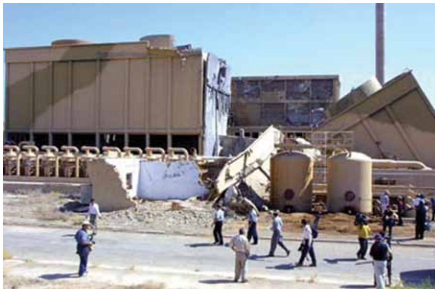
הריסות הכור באוסיראק כפי שצולמו ב-2002 | המערכה נגד תוכנית הגרעין של עיראק נמשכה כמעט 30 שנה - בין 1974 ל-2003 - והסתיימה בביטולו המוחלט של האיום הגרעיני העיראקי. בעתיד הנראה לעין קלושים הסיכויים שעיראק תחדש את מאמציה לייצר נשק גרעיני

זנח סדאם חוסיין את שאיפותיו להשיג נשק בלתי קונוונציונלי, ומאז פלישת הכוחות האמריקניים לעיראק ב-2003 כבר לא נשקפת ממנה שום סכנה לאזור - גרעינית או אחרת.