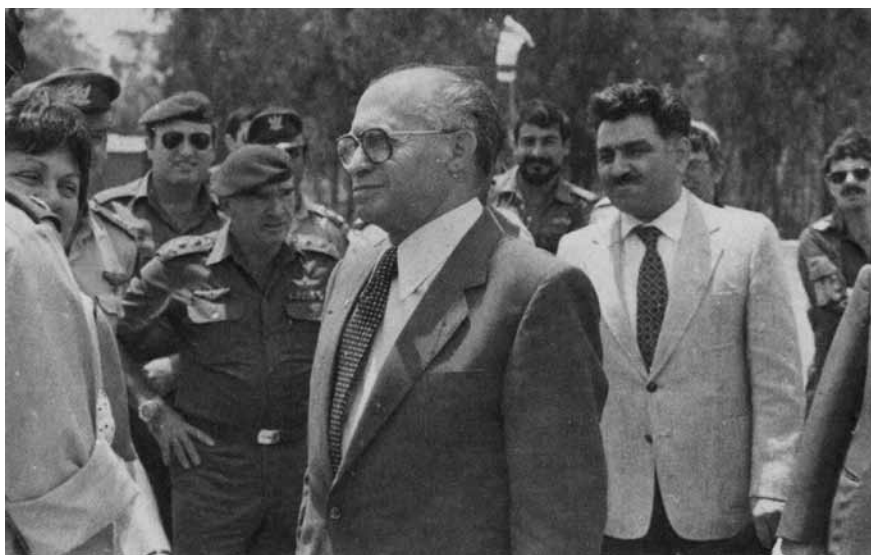
מנחם בגין ושרי הממשלה מבקרים בבסיס חיל האוויר, יוני 81 | לאחר המהפך של 1977 קבע ראש הממשלה בגין שיש לתת קדימה לגרעין העיראקי והורה לארגוני המודיעין לנקוט פעולות לסיכול התוכנית

האסטרטגית, אשר מוביל להגברת החינוך ברמה הקונוונציונלית, מתואר ומתועד רבות בספרות האקדמית ומכונה "פרדוקס היציבות-אי-יציבות".