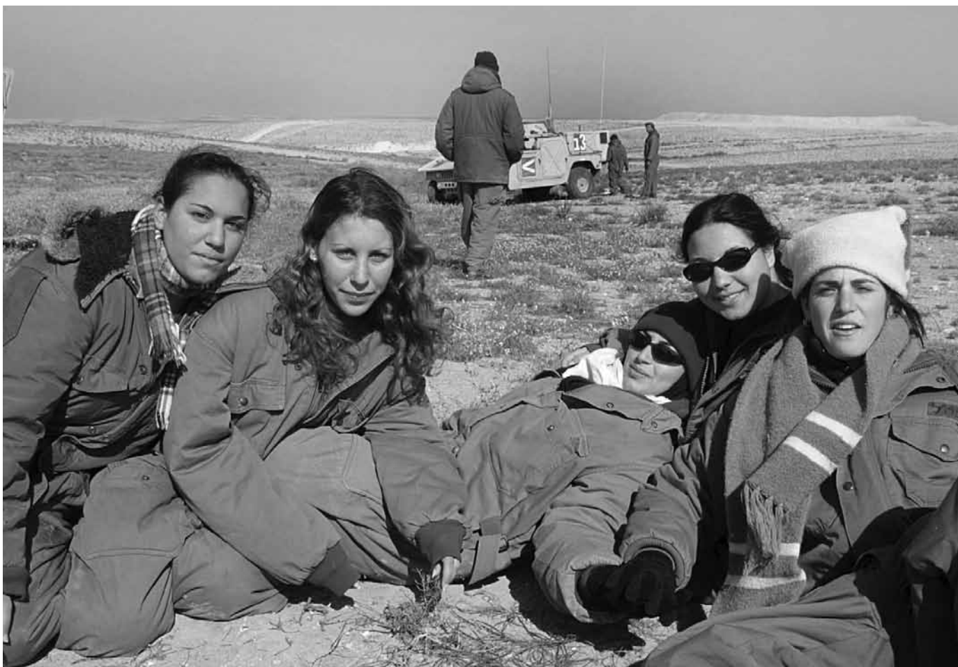
מילואימניקיות נחות במהלך תרגיל | התחושה שהן נחוצות לא רק מילאה את המילואימניקיות בגאווה והעצימה אותן אלא אף גרמה לחלק מהן להתנדב למילואים מעבר למחויבותן החוקית

על שואליהן שנקודת המוצא שלהם היא ששירות מילואים של נשים הוא תופעה לא טבעית. חוסר הטבעיות - בעיני השואלים - אינו נובע רק מכך שנשים מעולם לא השתתפו במוסד הזה, אלא מכך שהמוסד הזה נחשב תמיד באופן מובהק למעוז גברי, שכן תפקידו של הגבר הוא להיות לוחם במרחב הציבורי, ואילו תפקיד האישה, שנשאת מאחור במרחב הפרטי, הוא לדאוג למשפחה ולבית. הפליאה הספקנית שמעוררות המילואימניקיות ממחישה את העובדה שהשינוי המבני עדיין לא לוהט בשינוי תרבותי. הנשים חוות את הפער הזה בחיי היום-יום ביחידות המילואים שלהן: נוכחותן נתפסת כמשהו בלתי טבעי, ורבים רואים בהן זרות. לכן הן נאלצות להסביר באופן מתמיד לעמיתיהן מה הן בכלל עושות שם, ובמקרים רבים הן מופנות לתפקידים שנחשבים להולמים יותר נשים. כך קורה שהמילואימניקיות נאלצות לעיתים קרובות להיאבק על זכותן לעסוק במילואים בתפקידים שאליהם הן הוכשרו. הן זוכות להגנת יתר שבאה לידי ביטוי ביחס פטרוני ומפנק, דהיינו בדרישות מופחתות. בכך גורמים להן להיות קבוצה נפרדת ונבדלת מהכלל. חוויות הנשים במילואים מלמדות על כך שמתרחשת תופעה והיפוכה בעת ובעונה אחת: מצד אחד ננקט מהלך מבני שאמור להגביר את