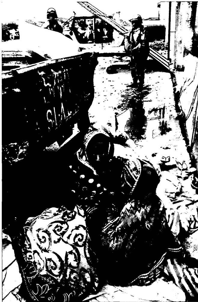
נחתים אמריקנים שומרים על נשים סומליות שהשליכו עליהם רימוני יד במהלך הלחימה במוגדישו

באוקטובר כיום חג לאומי, אך איזו משמעות יש לחג לאומי, כאשר אין בכלל אומה? כאשר מת איידיד ב-1996, המשיכו להשתולל בסומליה המלחמות הבין-שבטיות – מציאות שארה"ב והאו"ם ניסו לשים לה קץ על-ידי הקמתה של ממשלת קואליציה יציבה. אנשי השבט של איידיד עדיין נלחמים נגד שבטים יריבים וממשיכים