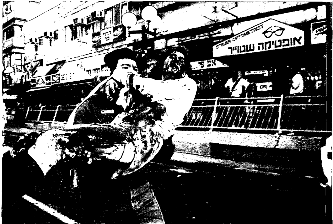
פיוני נפגעים לאחר פיגוע ברחוב דייזנגוף. גם ללוחמה בעצימות נמוכה יש מש- מעות אסטרטגית

נוכחותה של יישות מדינית נוספת ממערב לירדן - לאחר צמצום עומקה של ישראל במרכז המדינה