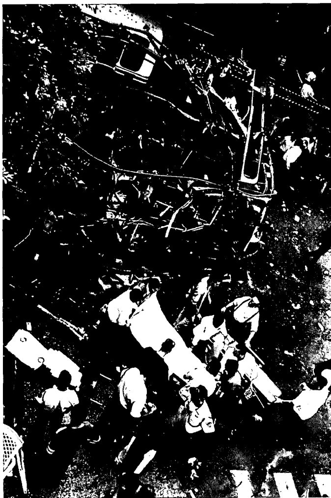
הפיגוע בקו 5 בתל-אביב. הישות הפלשתינית תישאר חממה לתנועות קיצוניות

מערכת המושגים האסטרטגית. שנית, הכנת מפת דרכים אינטלקטואלית או דוקטרינה מבצעית מתקדמת, שתתאים לתנאים הצבאיים המתפתחים ולתפיסות האסטרטגיות הרלוונטיות. שלישית, שינוי המבנה האופרטיבי של צה"ל והנהגת איזון שונה בין המרכיבים השונים של המערכת המתמרנת, בצורה שתבטיח לא רק יישום טוב יותר של היתרון הטכנולוגי של ישראל, אלא גם ניידות מבצעית, יכולת להלום וכושר לשמר את שלמות שטחה באמצעות הגנה התקפית, מפגשים מערכתיים ומבצעים ברמת עצימות נמוכה.