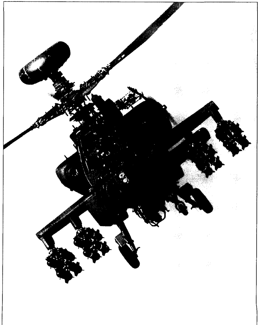
מסוק אפאצ'י. התקפה משוריינת תמשיך להיות איום מרכזי על ישראל

אף על פי כן, בשלב זה רצוני להוסיף שתי הערות: ראשית, התמורה המנטלית שהולידה את המהפכה השנייה לעולם לא הייתה קורמת עור וגידים לולא מלחמת יום הכיפורים והסכסוך השלום עם מצרים שבא בעקבותיו, לולא מלחמת לבנון, האינתיפאדה; מלחמת המפרץ השנייה וכינונו של סדר