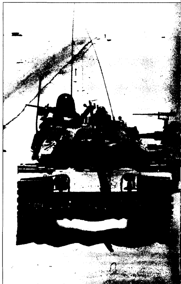
קווי המתאר של מדינת ישראל מקשים מאוד על המתכננים האסטרטגיים של צה"ל

מערכות לחימה יבשתיות ממוכנות, הנהנות מעדיפות מספרית יחסית, משלבות בתפקודן שני דרגים לפחות, הפועלים במשולב בזה אחר זה במתקפה ובמגננה כאחת: הדרג החזיתי והדרג העמוק. 21 השיטה הטובה ביותר לגבור על מערכות כאלה היא איפוא לנטרל את ההיגיון הטורי הפנימי שלהן, דהיינו לבתר את יחסי הגומלין המערכתיים בין הדרגים השונים ולשבש את יכולתה של המערכת היריבה להשיג את יעדיה האסטרטגיים. 22 השגת יעד זה במגננה מחייבת את המערכת המתגוננת לרכוש יכולת לפעול סימולטנית בחזית ובעורף של המערכת התוקפת, נגד דרגיה השונים או ציוותי הכוח המערכתיים שלה. 23