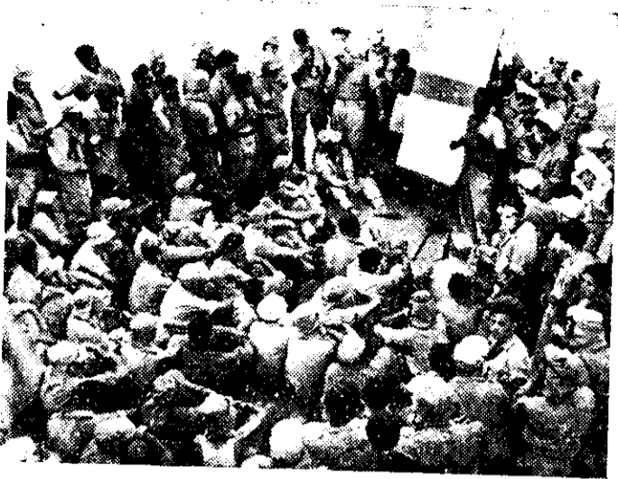
מפקד הפעולה מסביר את התכנית לכל האנשים

טיפולו ברכב. יש להתאמץ ולהוציא את המשורין של הלגיון משטח האש. מוצב עליו נשק א. ט. (תותח בן 2 ליטראות), ובעזרתו נהיה „מלכים“ (כשלנו גם פיאטים ורובה א. ט. שלקחנו בקולה).