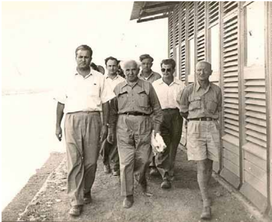
בן גוריון מבקר באילת, 1950 | מאחר שהנחת הבסיס הראשונה הייתה כי "ביטחוננו אינו תלוי בצבא בלבד", הרי לאחר שסיים את סקירת האיזונים וההזדמנויות בהקשר הצבאי-ביטחוני, חוזר בן-גוריון לטפל ב"גורמי ביטחון נוספים (מחוץ לצבא)" כמו הקמת יישובים חדשים, פיזור רצינות של האוכלוסייה וייהוד הגליל

מיטבית. זה בדיוק מה שעשה בן-גוריון, וניכר שהנטייה שלו הייתה להשתמש במה שהיום מכנים "טכניקות מסדר שני". הטכניקות האלה מחייבות לרוב חשיבה איטית יותר ומעמיקה יותר.