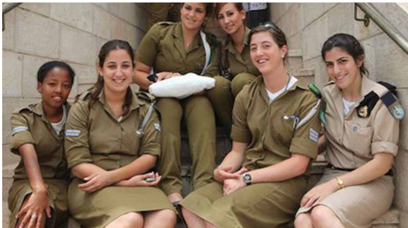
בנות דתיות שמשרתות בצה"ל | למרות המסלולים המיוחדים שמציע צה"ל, ושמותאמים לאישה הדתיה, נצפית בעשור האחרון מגמה עקבית של ירידה בשיעור המתגייסות לצה"ל ועלייה בבקשות לקבלת פטור משיקולי דת

ללא תשלום תמורת הלימוד במדרשה. ● גיוס לאחר שנת "מכינה צה"לית" המיועדת לצעירות דתיות בלבד לשם הכנתן הנפשית והפיזית למסגרת הצבאית. לאחר שקובעים מיהן הצעירות בכל מחזור גיוס שעוברות לטיפול המדור, מקדימים להן את הליכי הטרם גיוס כדי לאפשר להן לקבל תשובות בעניין המיונים ואז להחליט אם הן רוצות להתגייס או לממש את זכותן להצהיר (הן יכולות לעשות זאת עד 90 יום לפני מועד הגיוס). לצעירות הדתיות מוצעים 17 תפקידים הפתוחים לבנות לאחר יום המא"ה ר-14 תפקידים המחייבים מיון נוסף. התפקידים מוצעים בהתאם לרצון החילות השונים לשווקם ועל פי יכולתן של היחידות הקולטות להתחייב לקבל את המשרתות הדתיות בצמדים ולשמור על סביבה שמתאימה להן. הצעירות יכולות לבקש שיבוץ גם בתפקידים שלא נמצאים ברשימה שמציע המדור, אך המדור אינו יכול להבטיח את שיבוץ בהם בצמדים. המדור מסייע לצעירות במילוי ה"מנילה" (רשימת המקצועות שבהן מעוניין