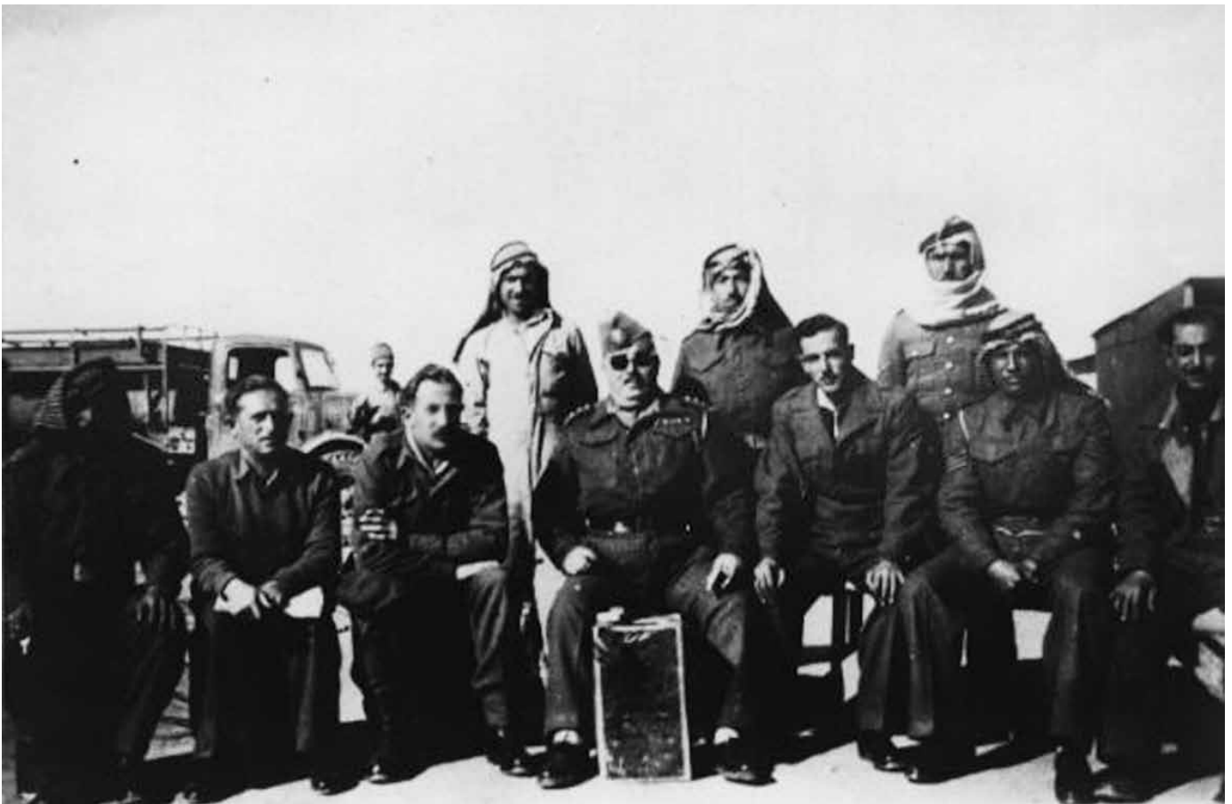
סגל מחנה השבויים: מפקד המחנה ופקודיו | בתחילה התנהגו בנוקשות לשבויים, בהמשך קיבלו אנשי המחנה את ניהול החיים הפנימיים, ואילו אנשי הלגיון נותרו לפקד מבחוץ

רבות הזמן היה לידידם של רבים מאיתנו, הרבה בשיחה וגילה בקיאות רבה".