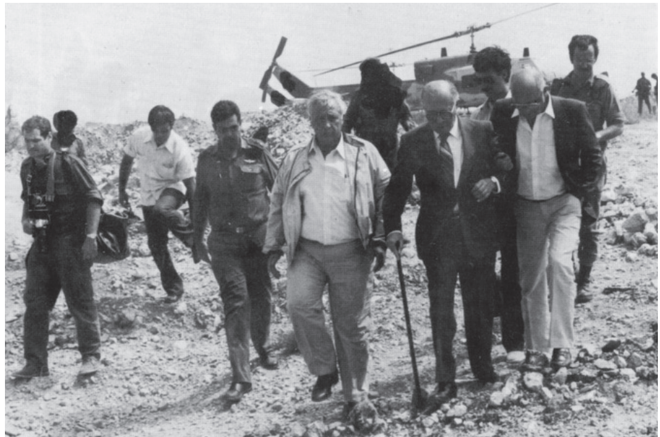
ביקור של מנצחים: ראש הממשלה, מנחם בגין, מבקר במבצר הבופור אחרי שנכבש ב־7 ביוני 1982 | עד שהתמנה אריאל שרון לשר הביטחון, דיברו ראשי צה"ל ושר הביטחון באותה השפה ועל אותה מטרת מלחמה