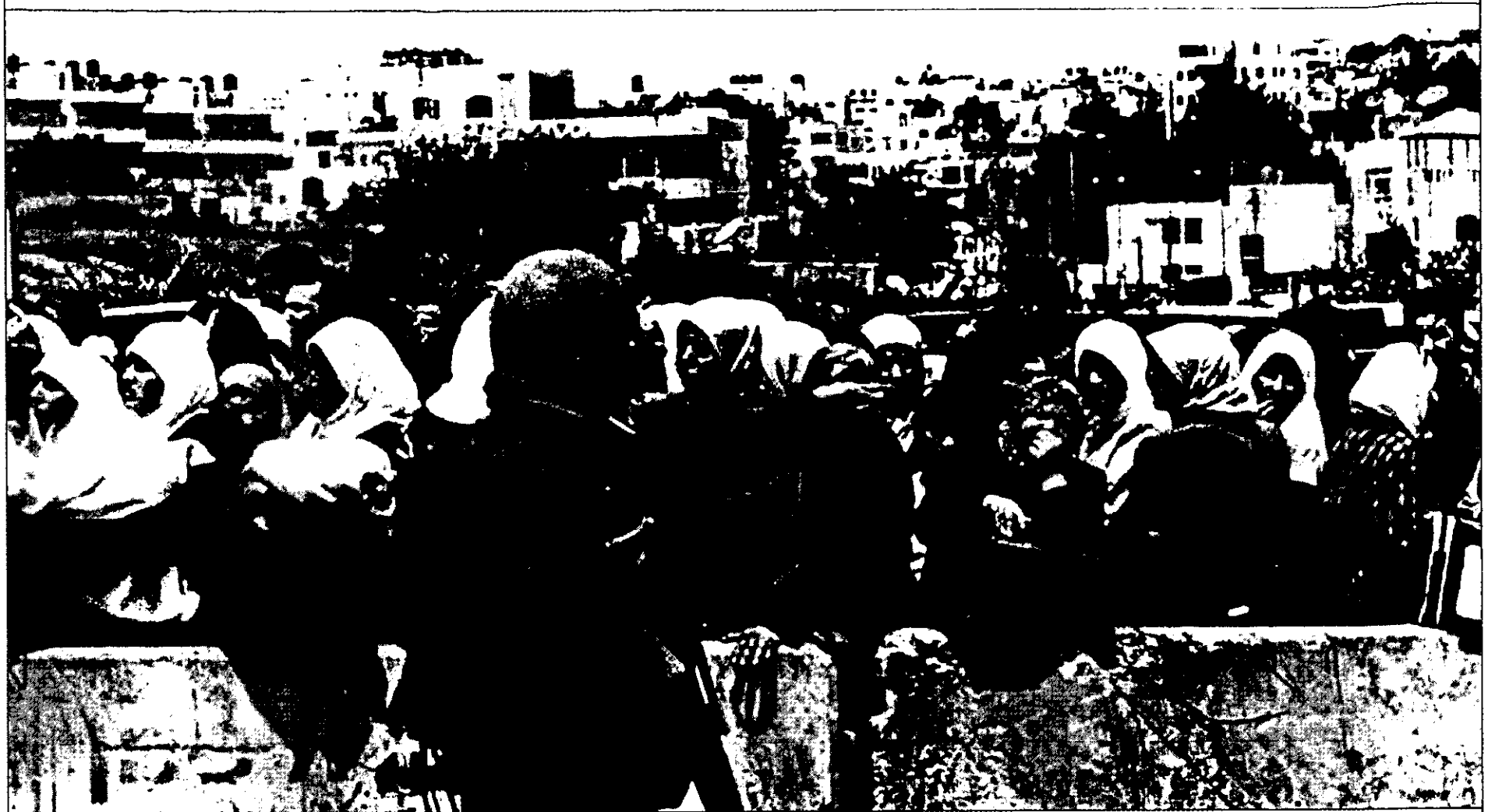
בלחימה בשטח רווי אוכלוסייה אזרחית קיים קושי אובייקטיבי להפריד בין האויב לאזרח התמים

יידרש לפעול במציאות שבה המערכת לא תוכל לספק לו את המידע שהורגל לקבל – בין אם משום שסביבת הלחימה השתנתה ובין אם משום שהמערכת קרסה. כשזה יקרה, יתברר לו כי כשירותו לפעול בתנאי אי-ודאות היא נמוכה מאוד.