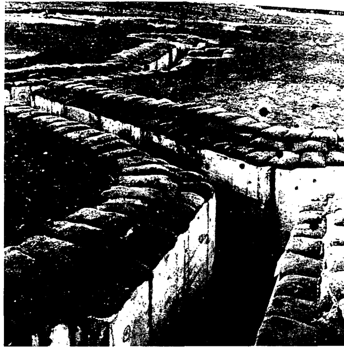
תעלות וחפירות הגנה כיישוב בקו העימות

ליישוב. נהפוך הוא, כמעט בכל גזרה קיים חלק ריק של מספר ק"מ בין יישוב אחד למשנהו, ובו קבועים בדרך כלל מוצבים של צה"ל. על בני הגמ"ר מהיישובים הסמוכים לתפוס מוצבים אלה עד הגעת כוחות צה"ל, סדיר או מילואים. כן יהיה עליהם לאבטח מתקנים חיוניים במרחב, צירים, גשרים וכדומה. בני המקום מכירים היטב את השטח, ואין ספק כי יגיעו ליעדם, ביום או לילה, במהירות המרבית. שום כוח צבאי לא יוכל להשתוות ללוחמי הגמ"ר באזור מגוריהם. בעיות הביטחון שלנו מחייבות אפוא שנראה