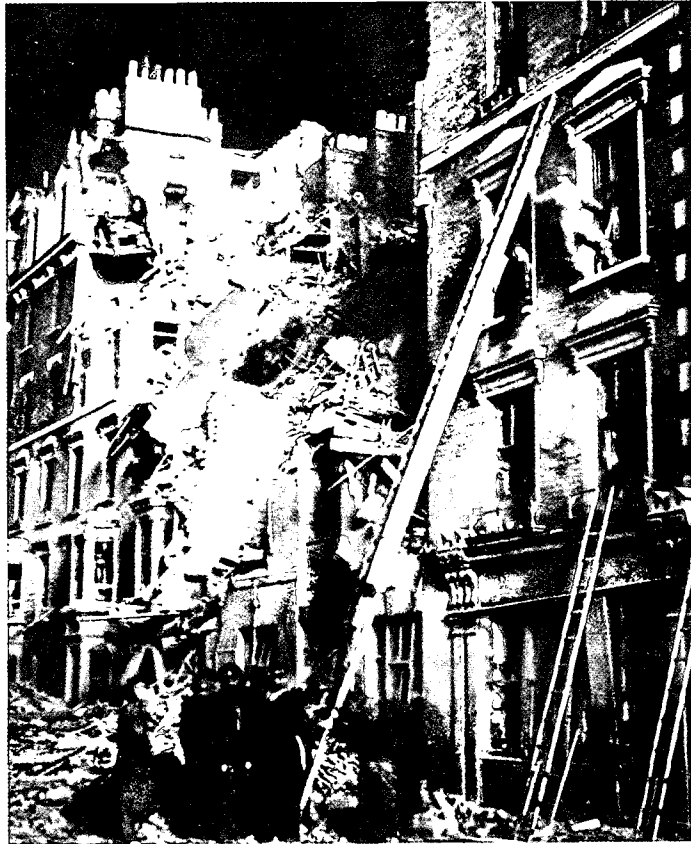
תמונה אפיינית באנגליה בעת הפצצות הגרמניות במלחמת העולם השנייה

המשא"ז להוות כוח ראשון שיתגייס לאבטחת מתקנים חיוניים בתוך הערים ובקרבתן, עם קבלת התרעה על מלחמה או עם פריצתה. אבטחה מידית של מקומות חשובים חיונית עד מאוד להסדרת גיוס מהיר של כוחות המילואים. רק אנשים הגרים סמוך למתקן ומכירים היטב את השטח בו הוא מצוי יוכלו להגיע למקום תוך דקות ספורות ולשמרו בפני כל פיגוע, עד להגעת אנשי האבטחה של הג"א. הטובים ביותר למשימה זו הם בני הנוער, הגדניים, ואת חלוקת הגזרות ביניהם יש לתכנן