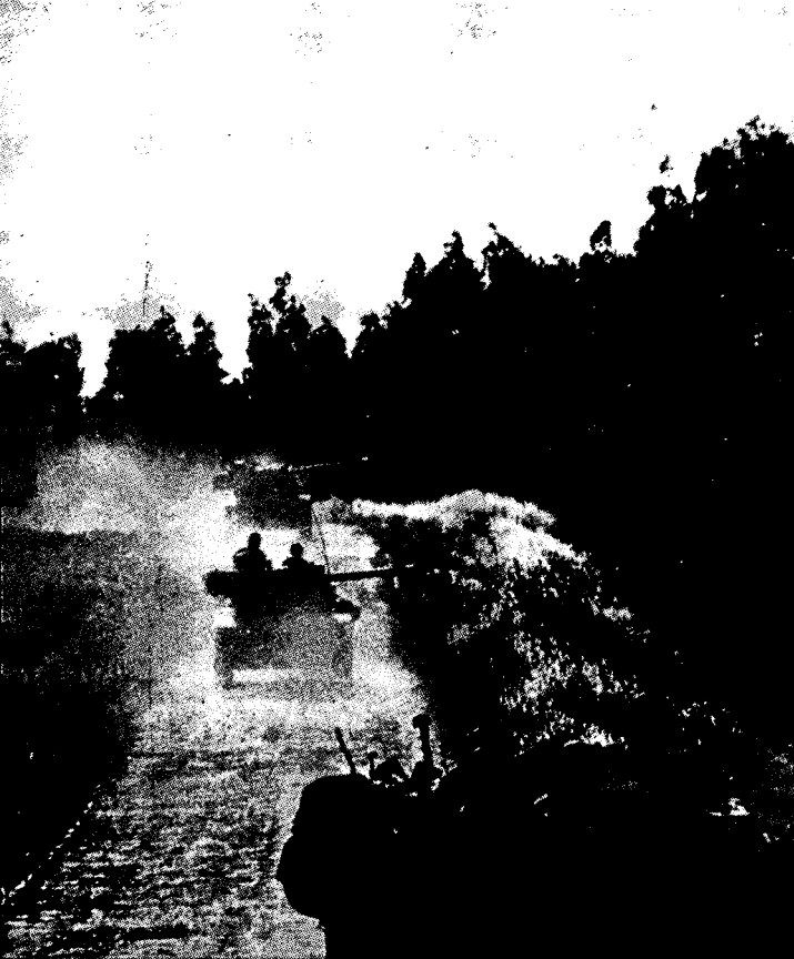
הטנקים בתנועה למגע

עם טנקים ותותחני-ט של האויב צפונית מאל-קובה, לכיוון עלי-מונטאר. עוד בתחילת הדרך התקלקל אחד הטנקים, ואילו טנק נוסף עלה על מוקש ליד שביל-הפטרוולים. נותרו טנקים מעטים בלבד, ואלה לחמו כ-45 דקות נגד מוצב האויב בעלי-מונטאר, על מערך הנ"ט והטנקים שבו. הזחל"מ, שנע בראש הטור שלי, מימין למחנה-האוו"מ, עלה על מוקש ונתקע במקומו. הזחל"מים האחרים ניסו לנצל את התוואי בו נסע הזחל"מ הפגוע ולנסוע בו — אך עלו גם הם בזה אחר זה על מוקשים, אף שניסו לנוע דרך שטחים מעובדים. בראותי את זחל"מ המ"פ עולה בלהבות, פתחתי בדהרה שמאלה — כדי לקבל את הפיקוד על הכוח. כשלושים מטר מן המוצב עלה אף הזחל"מ שלי על מוקש, וכל יושביו נפצעו; אני עצמי נפצעתי ברגלי. אולם מייד התאוששנו והמשכנו לנהל את הקרב. אחד הטנקים, שנפגע מפגז-תול"ר ועמד בינינו לבין המוצב, הסתיר אותנו מעיני-האויב. אחד מאנשי-הצוות של אותו טנק נהרג; מפקד-הטנק, שנפצע קשה, שכב לידו — ואילו הנהג הועף מכוח-ההתפוצצות ורץ לעברנו. משזיהה אותנו, קפץ לתוך הזחל"מ במין קפיצה משונה, כמו דג, כשראשו נטוי קדימה. נסתבר, כי הוא פגוע בכל גופו ואנו טיפלנו בו. המקום בו נתקענו, בין בוסתנים שורצי חוליות-מקלע שירו לעברנו אש-תופת, לא איפשר לנהל ממנו את הקרב. צפיתי לעבר המוצב — והתמונה שראיתי הייתה עגומה. לפני שמכשיר-הקשר שעל הזחל"מ שבק חיים תפסתי את המיקרופון והוריתי לסמג"ד...".