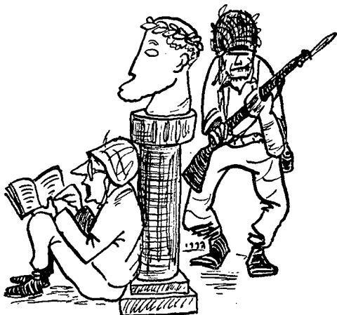
...איש המעשה ואיש התיאוריה

החיל. דומה הדבר ליחס שבין ידיעת מקצוע לבין ידיעות המונחים בהם משתמשים במקצוע מסוים. "לימוד המונחים" אינו הופך את הלומד לבעל-מקצוע. מצד שני, אי-אפשר לדעת את המקצוע מבלי דעת את המונחים הקשורים במקצוע. אלה הם שני תהליכי-לימוד ששניהם נחוצים באותו תהליך אחד של קליטת המקצוע.