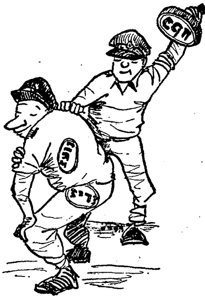
...הרינו מחוים את דעתנו עליו"

אל הביצוע, בהתאם לאותם ציונים. לפי קו-מחשבה זה — באם נביאהו לידי גילוי הקיצוני — הרי אדם העובר בגשר ורואה איש טובע בנהר, יצטט תחילה לעצמו חוק-מוסרי הגוגע בעגין, ורק אח"כ יקפוץ למים כדי להציל את הטובע; או שנצטרך לתאר לעצמנו מתאגרף, למשל, מצטט לעצמו במהי-רות על-אנושית את חוקי-הבוכס לפני כל מכה שהוא מנחית.