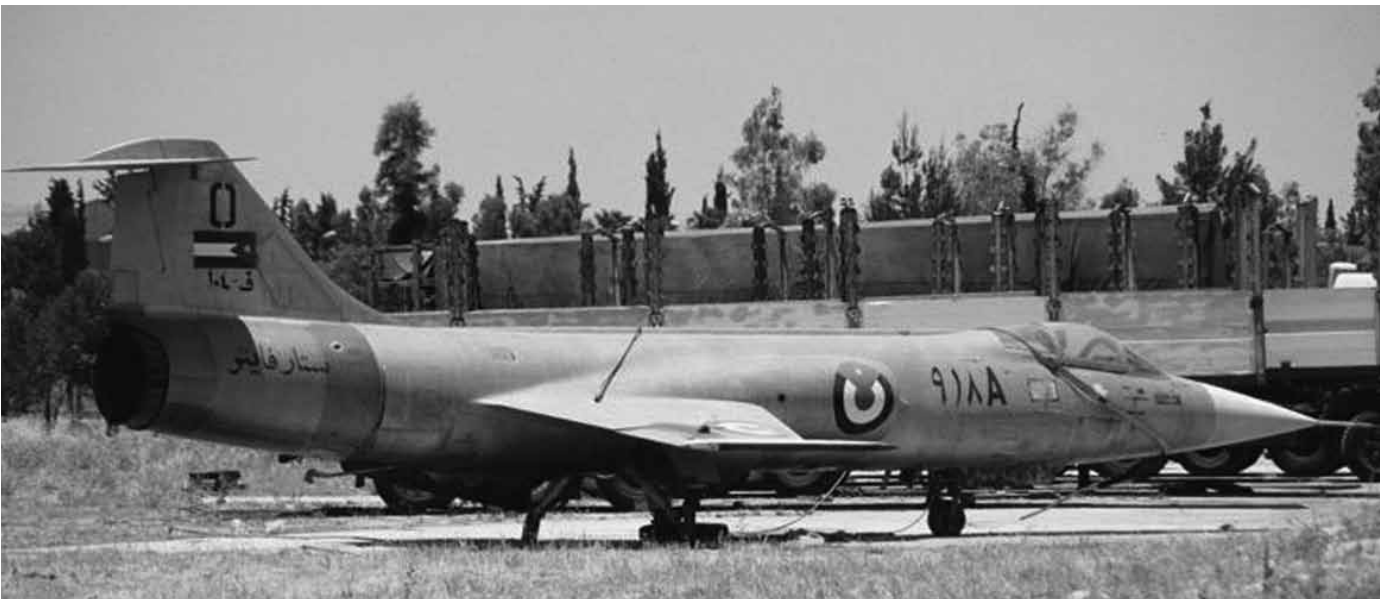
מטוס סטרפייטר ירדני | האמריקנים לא דייקו במידע שמסרו לישראל על כמות הטנקים שבכוונתם לספק לירדן ועל איכותם ולא מסרו על כוונתם לספק לירדן מטוסי קרב מסוג סטרפייטר (F-104)

מלגלות לישראל את כל העובדות. כך, למשל, האמריקנים לא דייקו במידע שמסרו לישראל על כמות הטנקים שבכוונתם לספק לירדן ועל איכותם. האמריקנים גם לא מסרו על כוונתם לספק לירדן מטוסי קרב מסוג סטרפייטר (F-104). הדיונים בין ישראל לארה"ב היו קשים וקולניים, וכל צד הפעיל תרגילים רבים לשיפור מצבו. עם זאת, הרושם שעולה מהפרוטוקולים האמריקניים הוא שהנשיא לא התרגש מההתנהלות העיקשת של הישראלים. לעומת זאת, לצמרת משרד החוץ ולקומר, כרגיל, היו טענות רבות כלפי הישראלים וכלפי אופן התנהלותם.