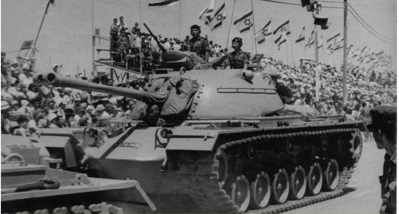
סנקי פטון במצעד יום העצמאות של צה"ל בירושלים ב-1968 | ישראל ביקשה לא לשלם בעבור 300 סנקי הפטון (שהזמינה - בגלל מצבה הכלכלי הדחוק

מנהיגי ארה"ב בנוגע למחויבותם לביטחון ישראל. לבסוף הם המליצו שישראל תבוא לקראת הערבים בסוגיית הפליטים. על אף הסיכום המאכזב, שביטא את ההשקפות המסורתיות של משרד החוץ האמריקני, הגישה ישראל ב-2 בינואר 1964 בקשה לרכישה מיידית של 300 סנקי פטון: 200 סנקים מהדגם הישן יותר של הפטון, M-48A3, ו-100 סנקים מהדגם החדש - M-60. כן כללה הבקשה אופציה לרכישה של 200 סנקים נוספים מדגם M-60 בתוך שנתיים-שלוש. ישראל גם ביקשה לא לשלם בעבור הטנקים בגלל נטל הביטחון ומצבה הכלכלי הדחוק.