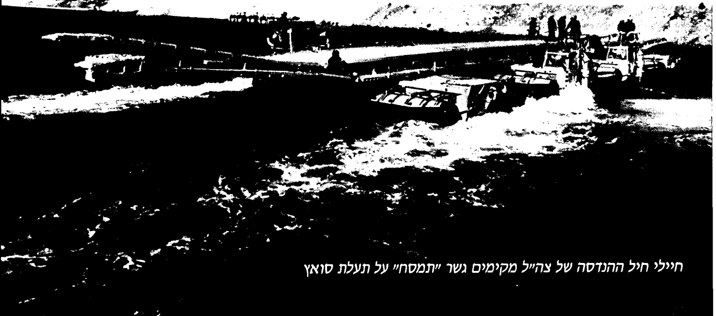
חיילי חיל ההנדסה של צה"ל מקימים גשר "תמסחח" על תעלת סואץ