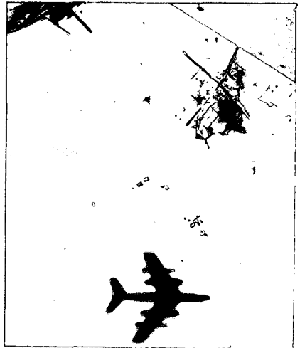
אם רוצים לשמור על האיכות אסור לפגוע במערכת ההשגת

הערובה השנייה לכך, ודומה כי צה"ל הולך בדרך זו, הנה מבנה צה"ל ובעיקר מבנה כוחות המילואים. צה"ל כיום הנו צבא גדול גם במושגים בינלאומיים. יש