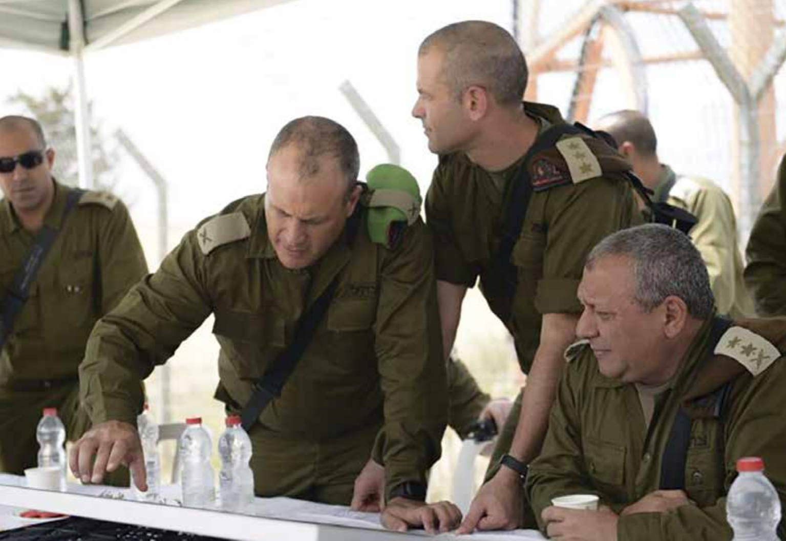
הרמטכ"ל גדי איזנקוט מבקר באוגדת עזה. במסמך "אסטרטגיית צה"ל", בפרק המתאר את המסגרת האסטרטגית, הנחה הרמטכ"ל גדי איזנקוט את צה"ל לאמץ שני עקרונות עבודה כדי ליישם את מרכיבי היבט הצבאי של תפיסת הביטחון של מדינת ישראל - הרתעה, התרעה, התגוננות, וכמובן, הכרעה וניצחון

הפיקוד הגיע צה"ל למלחמה בבלבול מוחלט. כל דרג מדבר בשפה שונה, ורואה את הדרך אל הניצחון מנקודת זווית שונה לחלוטין 7 .