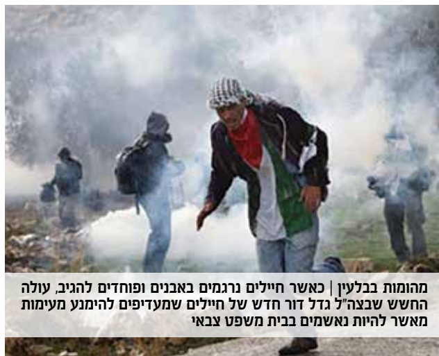
מהומות בבלעין | כאשר חיילים נרגמים באבנים ופוחדים להגיב, עולה החשש שבצה"ל גדל דור חדש של חיילים שמעדיפים להימנע מעימות מאשר להיות נאשמים בבית משפט צבאי

ההערות למאמר הזה מתפרסמות באתר הוצאת מערכות.