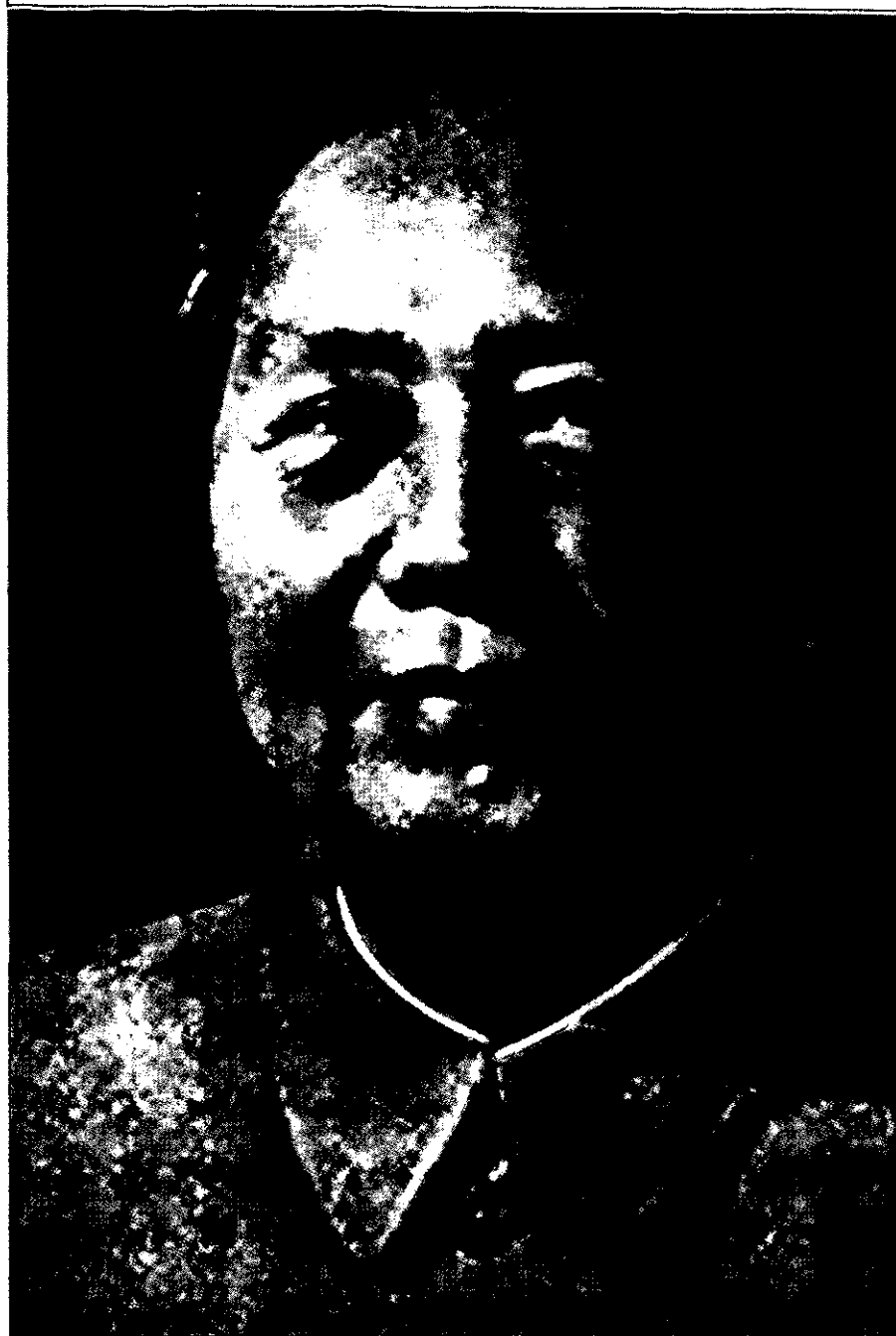
"האופנסיבה והדפנסיבה אינן אלא שני צדדים של אותו מטבע"

באמצעות פעילות ממוקדת וחשאית, המתבססת על מודיעין איכותי (יומינ"טי, ויזינ"טי וסיגינ"טי). לכן הפעילות המודיעינית נחשבת למאמץ בפני עצמו לצד המאמץ ההגנתי והמאמץ ההתקפי. המאמץ המודיעיני של צה"ל ושל השב"כ הוא כלי שרת מהמעלה הראשונה במאמץ ההגנתי בעימות הזה, ולכן יש להגבירו ולהשתמש בו בכל עת.