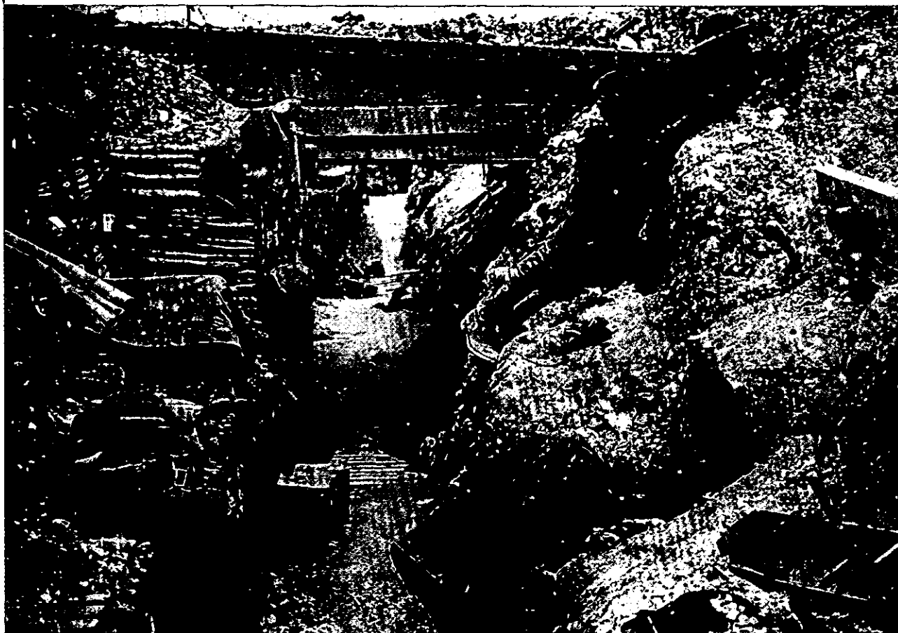
בשלהי 1916, תוך כדי הלחימה בסוס, התפתח ויכוח אצל הגרמנים בין שתי גישות הגנה שונות: ההגנה הקשיחה וההגנה הגמישה

ייאלצו לסגת. משום כך הצליחו לעיתים הגרמנים בחודשים הראשונים של המלחמה לאתר אגפים חשופים במערכי ההגנה שלפניהם ועלידי כך להדוף לאחור גם את המגינים החזקים ביותר.