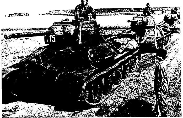
טנקי "טי-34" של הצבא האדום. הם היו חוט השדרה של השריון הסובייטי בקרב קורסק

טנקים ותותחי סער סובייטיים מול כ-600 טנקים ותותחי סער גרמניים). בערב ניתקו הכוחות מגע, בלי שצד כלשהו הצליח להתקדם. עיון בנתוני האבדות שנגרמו לשני הצדדים מעלה תוצאה מפתיעה: מתברר כי דיוויזיית הסי"ס "לייבשטנדרטה", אשר ספגה את עיקר ההתקפה הסובייטית, איבדה באותו יום זה כ-375 הרוגים ופצועים, אך רק 12 טנקים ותותחי סער, בעוד שאבדות השריון של הסובייטים היו כבדות בהרבה. קורפוס השריון 18 ו-29 מהארמייה ה-5, שהובילו את ההתקפה הסובייטית, איבדו ביום זה 180-200 טנקים ותותחי סער מתוך ה-400 שהם הטילו למתקפה. באותו לילה התחפר השריון הנוותר של הארמייה ה-5 לחיזוק מערכי ההגנה, ואילו היחידות הגרמניות נדרשו לחדש את תנועתן לעבר פרוחורובקה כבר למחרת בבוקר. כאשר הן ניסו לעשות כן, התברר שהן הגיעו לקצה גבול יכולתן, והתקדמותן נבלמה.