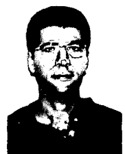
בעבר לוחם בשריון

לכך כי הוא עתיד לחרוץ את גורל המלחמה כולה, ולכן התלבטה המפקדה הגרמנית העליונה ממושכות בטרם אישרה אותו. לרוע מזלם של הגרמנים העבירו רשתות ריגול את פרטי המלאים של המבצע לידי הסובייטים, כך שכאשר אושר לבסוף, והכוחות הגרמניים החלו בתנועה, הם נתקלו במערכי הגנה דרוכים ומעובים