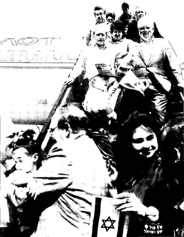
שיבת ציון היא בגדר מעשה צדק לנרדף ולמקופח בעמים

בדור אחד ולאבד את הטובים בשדות הקרב, וכואב לה שהיהודים אינם באים, וכואב לה שדמות החברה כאן מתעוותת. אך אין "ציונות דה-לוקס", ללא דם ודמעות וזיעה וכישלונות. אין בונים עם בדור אחד. כמה זמן לחמו ההולנדים, למשל, עד אשר זכו בחירות? הפולנים עדיין לוחמים. כדי לגבור על המשבר ועל הייאוש יש לראות את הדברים בראייה פנורמית. הנה מאה השנים האחרונות 1881-1981. מאה שנים ל"סופות בנגב", לפוג-רומים בדרום רוסיה, ראשית הגירת מיליונים