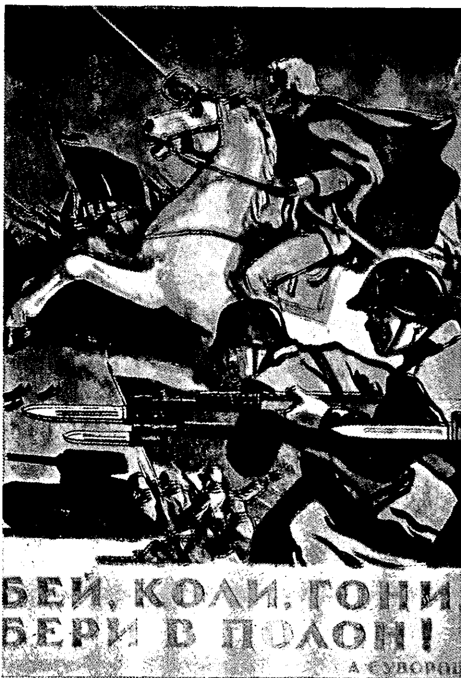
„הד, דקור, הדוף, ורצוף“, אמרת סבורוב, המופיע רכוב על סוס, בכרזה של הצבא הסובייטי בימי מלחמת־העולם השנייה.

לפנינו, אנשי הצבא, מצטיירת דמות כזו של מנהיג מופלא, מחדש בתורת־הלחימה ומשנה מוסכמות, מפקד נועז השש־אלי־קרב — אמן הניצחון. אנשי צה"ל ימצאו בו אולי עניין רב יותר מאשר קוראים הנמנים על כל צבא אחר.