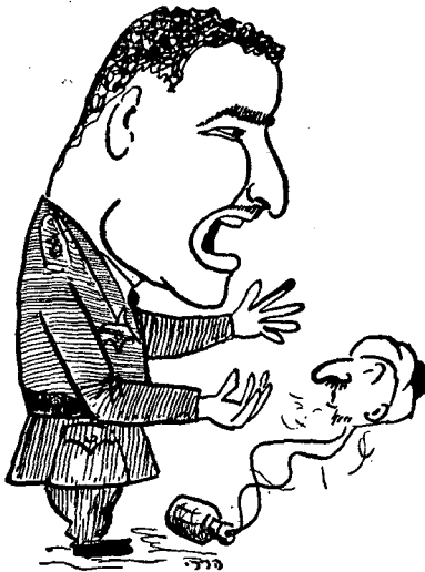
מדינאים השואבים את השראתם מסיפורי אלף-לילה-ולילה

א. להיערך מראש לקראת הדיפת התקפה כללית של כוחות האויב ולהבסתם המוחלטת.