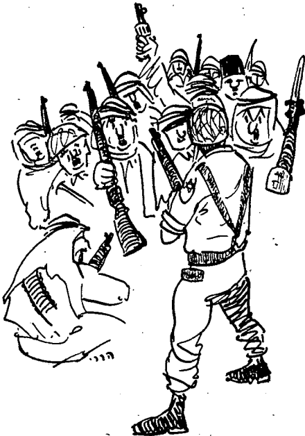
מזל כל ישראלי — מעל ל-30 ערבים

הגבול הימי נכלל בהגדרה זו שכן "גשלט" הוא