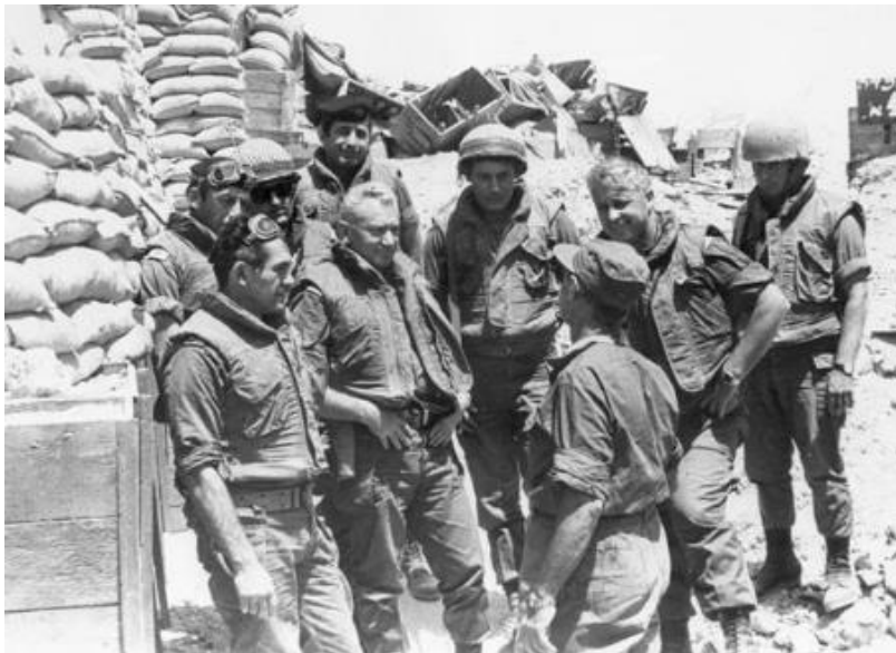
מפקדי צה"ל בסיור מוצבים במלחמת ההתשה 29

נראה לי שהצבת חטיבה 7 בסיני מאפשרת לסכל ניסיונות צליחה מבחינת יחסי הכוחות והיא נותנת זמן ומרחב לצבירת סד"כ. כוח כזה, כוח של 300 טנקים בסיני, נותן לנו את האפשרות לשבור מתקפה. לא נותן לנו אומנם, לעבור לצד השני, אולי רק בהישגים קטנים, מצומצמים (בגדה המערבית), בגזרה הצפונית, שגם הם חשובים – אבל נותן אפשרות של סיכול ובלימה של כוחות.