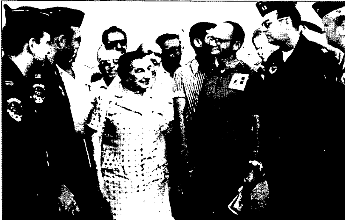
גולדה מאיר עם הצוות האמריקני בנמל התעופה בלוד

אין ספק שתהליך קבלת ההחלטות בארה"ב באשר לשאלה אם לתת סיוע צבאי בעת חירום לישראל יביא בחשבון את תמונת המערכה ואת התחזית באשר למשמעות שתהיה להטלת משקלה של