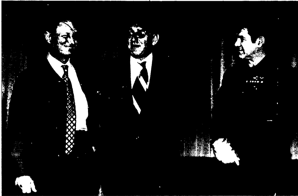
קיסינג'ר, דיין ודדו נפגשים זמן קצר לאחר תום מלחמת יום הכיפורים. בשבוע הראשון למלחמה היה שר החוץ האמריקני משוכנע שמשלוחי נשק לישראל נוגדים את האינטרס האמריקני, ולכן הוא מנע אותם

ראשי הדרג המדיני באותן השנים, ראש הממשלה מאיר ושר הביטחון דיין, נתנו ברבות השנים את גרסאותיהם