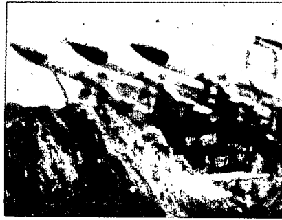
צילום נדיר של טולי SA-6 בבקעא באביב 1981 (Soldat und Technik) — יולי 1981

בניגוד להנחות ולהערכות סוריות וישראליות רבות שהתבררו בשנים שלאחר הפלישה ללבנון הוכחה ההבנה הבלתי כתובה כאיתנה וכבעלת חיות. בשנים 1977-1978 הוצבו, פעמיים, סימני שאלה מול הבנה זאת ובשתי הפעמים