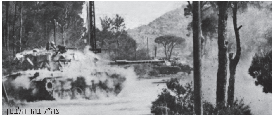
צה"ל בהר הלבנון

הלחימה נעשתה בשדרות. הכוח חולק לשלושה כוחות משנה: 1. על הכוח בפיקודו של מח"ט בני אור הוטל