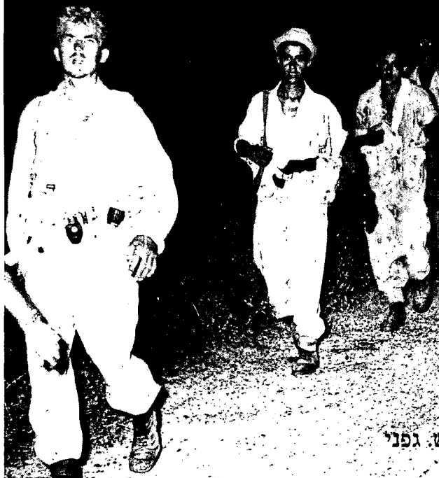
עיבוד: ש. גפני